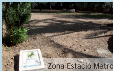
Zona Estació Metro