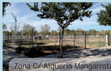
Zona C/ Alqueria Mangarrotta