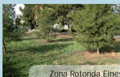
Zona Rotonda Eines