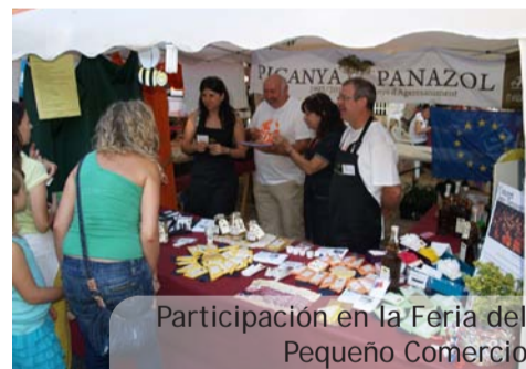
Participación en la Feria del Pequeño Comercio