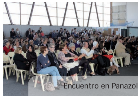
Encuentro en Panazol