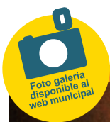
Foto galeria disponible al web municipal