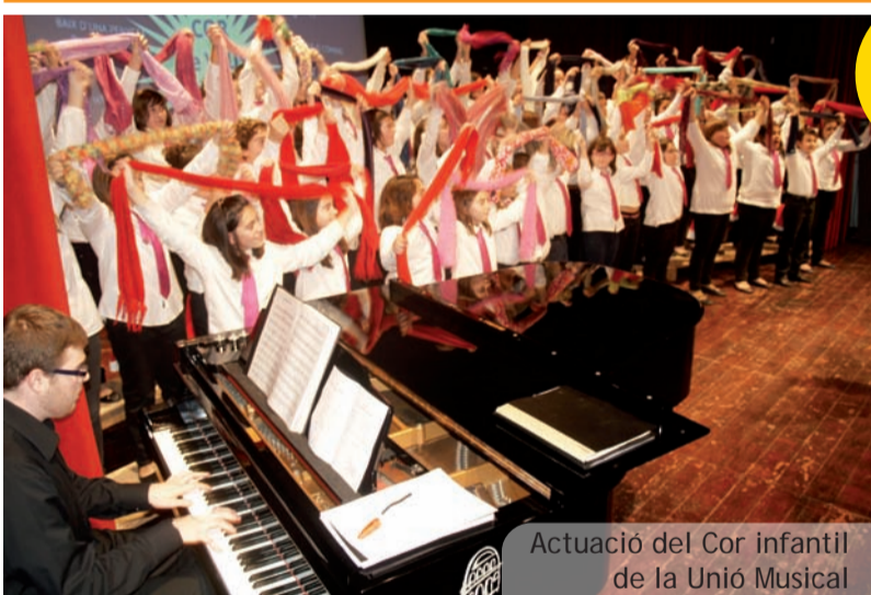
Actuació del Cor infantil de la Unió Musical