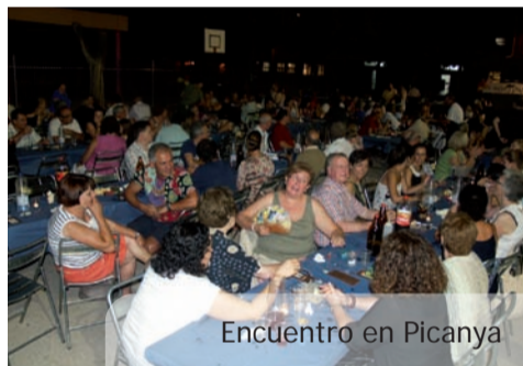
Encuentro en Picanya

Animamos a todos a participar en las acciones del hermanamiento. Podéis solicitar más información en las oficinas municipales.