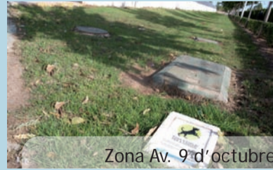
Zona Av. 9 d'octubre