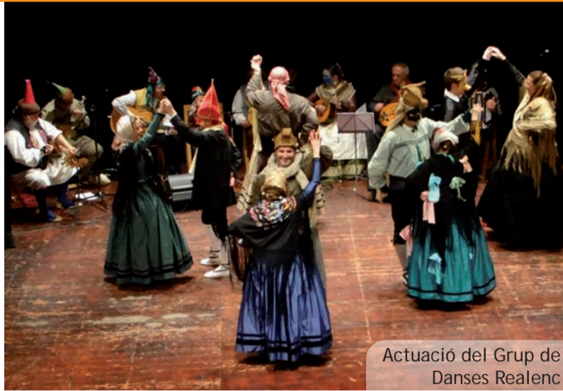
Actuació del Grup de Danses Realenc