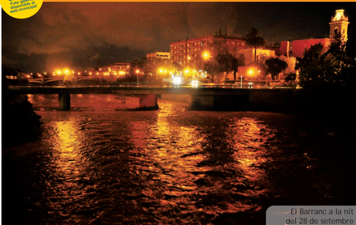
El Barranc a la nit del 28 de setembre

Foto galeria disponible al web municipal