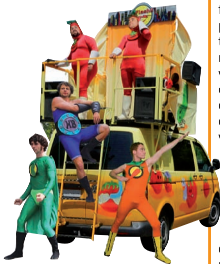
Flash!! de +Tumacat

Teniu tota la informació al web municipal: www.picanya.org