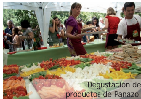
Degustación de productos de Panazol