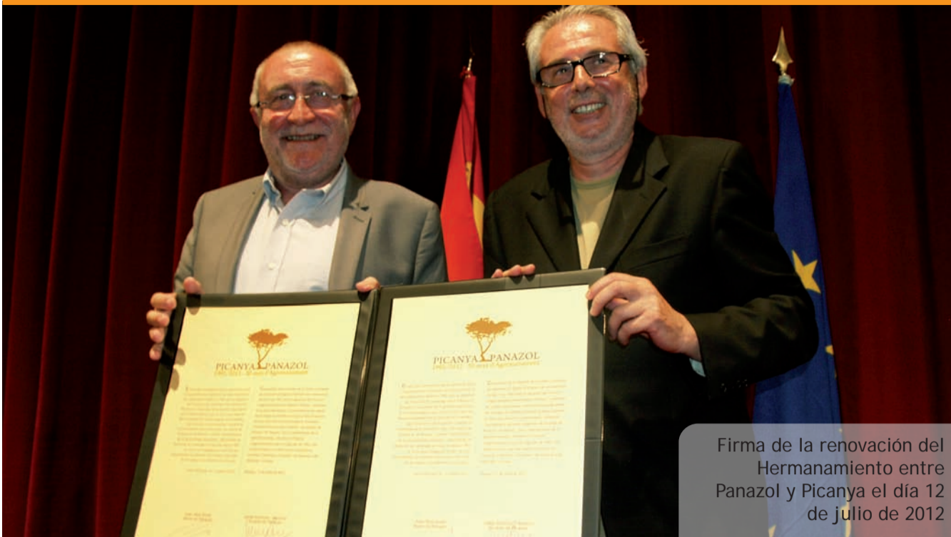
Firma de la renovación del Hermanamiento entre Panazol y Picanya el día 12 de julio de 2012

Para mayor información hay que contactar con los respectivos colegios.