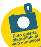
Foto galeria disponible al web municipal