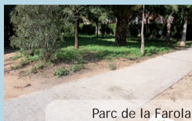
Parc de la Farola

Al mateix temps també s'han marcat com a zones prohibides als gossos els espais amb jocs infantils sobre els que s'han de mantindre unes majors condicions d'higiene.