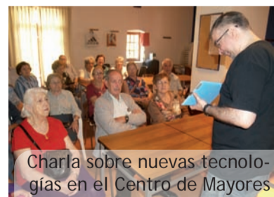
Charla sobre nuevas tecnologías en el Centro de Mayores

El día 12 de marzo, encuentro comarcal en Picanya.