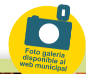
Foto galeria disponible al web municipal

L'acte de lliurament de trofeus, presidits pels Alcaldes de Picanya i Paiporta i pels presidents dels clubs d'atletisme organitzadors de la prova, van posar punt i final a aquesta 20a Edició de la Quarta i Mitja Marató, tota una clàssica del calendari de curses populars de la Comunitat Valenciana que any rere any no ha deixat de créixer tant en participació com en valoració per part dels atletes populars del nostre país que troben en la Quarta i Mitja un magnífic escenari on compartir la seua afició.