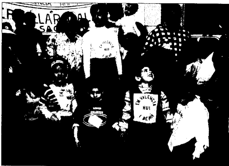
Pares, mares i escolars alumnes de Picanya a la Trobada d'Alboraià.

La celebració de la festa per la llengua, a més a més, es va completar dies abans amb la