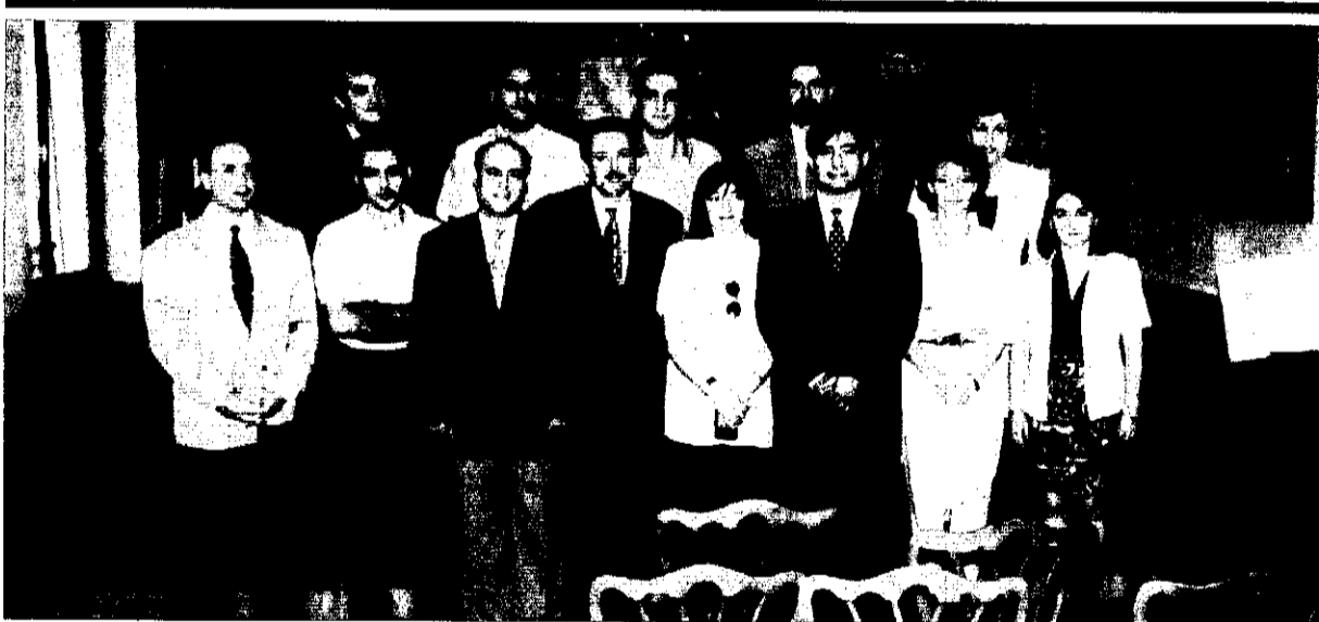
Ediles que forman la corporación municipal del Ayuntamiento de Picanya.