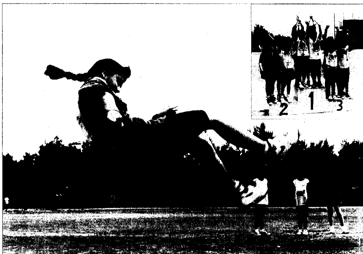
Els participants en els Jocs Escolars han demostrat sempre el seu esperit d'equip en les competicions.

Un altre atractiu dels Jocs Escolars, és que al llarg dels