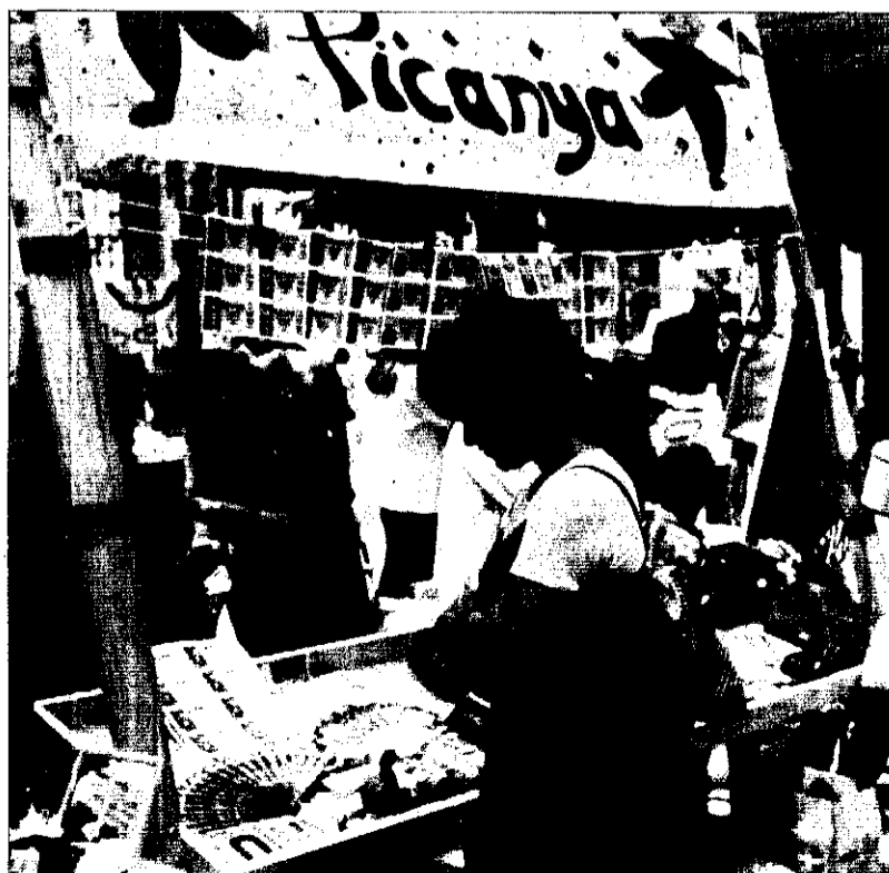
Un momento del Rastro Solidario celebrado en Picanya.