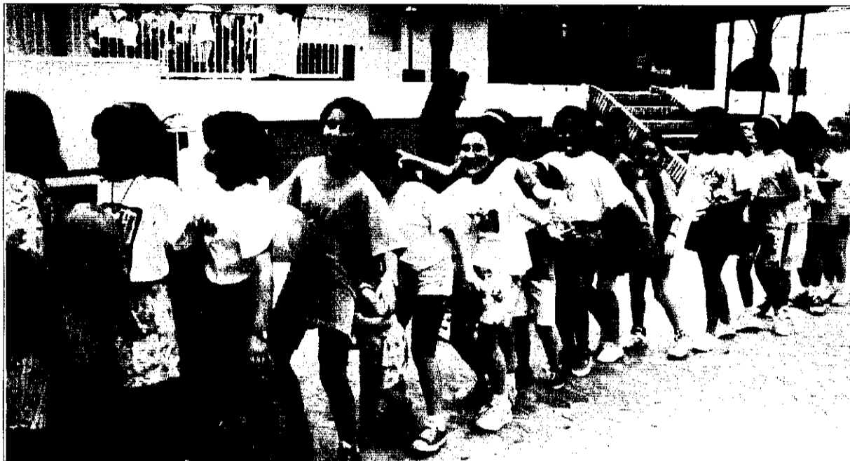
Els escolars, com mostra aquesta imatge de l'any passat, s'han integrat activament en les festes patronals.

Les festes patronals de Picanya compten enguany amb un ample programa d'activitats, preparat per totes les associacions del poble amb la coordinació de l'Ajuntament. En aquesta edició de les festes en honor a la Preciosíssima Sang, s'ha tractat de combinar la tradició del folklore i les bandes de música amb les innovacions, com ara les primeres 24 hores de dominó, la Festa Jove al parc de les Albízie, activitats culturals o la "coetà" infantil.