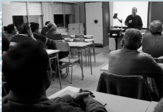
Un moment del curs de manipulador de plaguicides al CP Baladre

D'altra part, s'està continuant amb el reforç d'una de les vores del barranc junt a l'avinguda Ricard Capella (zona del pont nou), per tal de prevenir l'enderrocament del talús i el deteriorament de la zona enjardinada. Aquesta acció és continuació del mur anterior que ja dona suport a una part del talús i que en aquests moments ja comença a cobrir-se de vegetació amb la qual cosa millora la seua capacitat de resistència i la seua integració en el paisatge.