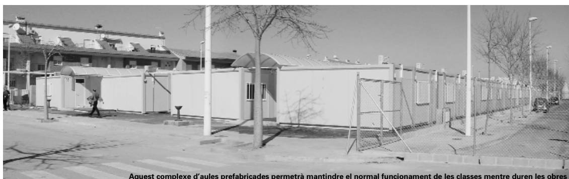
Aquest complex d'aules prefabricades permetrà mantindre el normal funcionament de les classes mentre duren les obres

Les obres del nou Institut d'Ensenyament Secundari de Picanya tenen un pressupost d'uns quatre milions d'euros, que finançarà la Conselleria d'Educació.