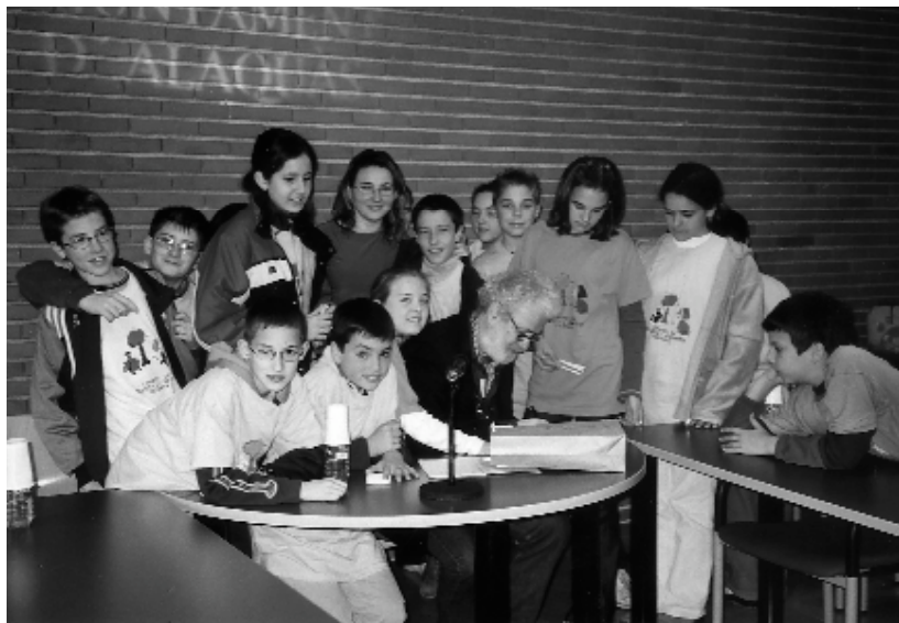
El Consell de Xiquets i Xiquetes amb el pedagog italià a l'Ajuntament d'Alaquàs