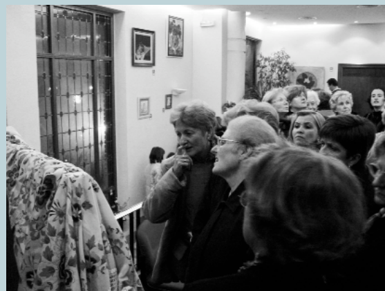
Inauguració de l'exposició "Art fet per dones II" a l'edifici de l'Ajuntament