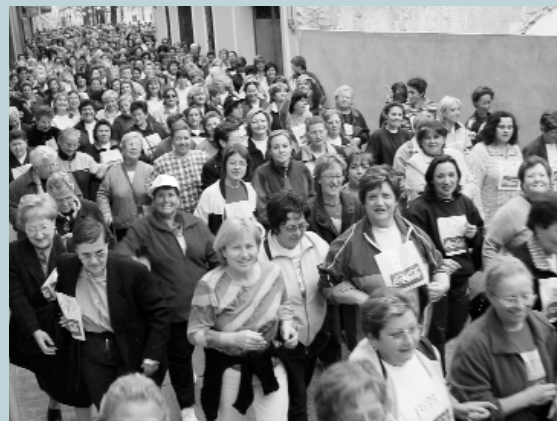
Un moment de l'eixida del 12è Recreo-Cross

Com a nota negativa, hem d'assenyalar que els problemes burocràtics a l'hora de l'obtenció del visat d'eixida va impedir el viatge de l'orquestra femenina "El Nor" del Marroc, raó per la qual es va haver de suspendre l'actuació d'aquest grup a Picanya com a part de la gira que volien realitzar per les nostres terres.