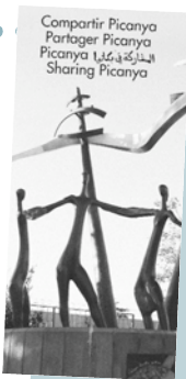
Coberta del fulllet