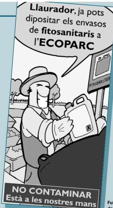
Fullet anunciador del servei

Podeu demanar aquesta agenda a l'Agència de Desenvolupament Local de l'Ajuntament.