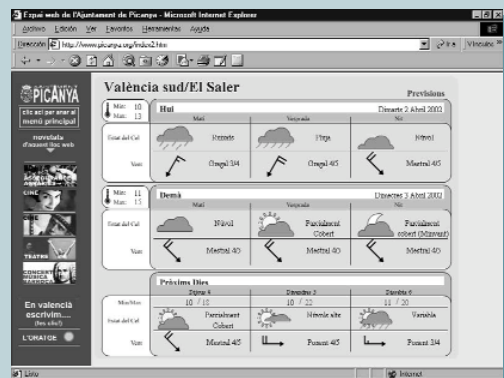
Al menú principal es troba l'enllaç per obtenir la previsió meteorològica

Des de l'Ajuntament de Picanya s'està planificant una completa campanya d'informació. L'objectiu principal d'aquesta campanya serà difondre l'ús de l'ecoparc, així com també que s'ha de fer per a dipositar els envasos de fitosanitaris buits. Cal recordar que aquests productes s'utilitzen al món de l'agricultura, la jardineria i també a l'àmbit domèstic i que per la seua perillositat per al medi ambient, necessiten d'un mètode de recollida i tractament específic.