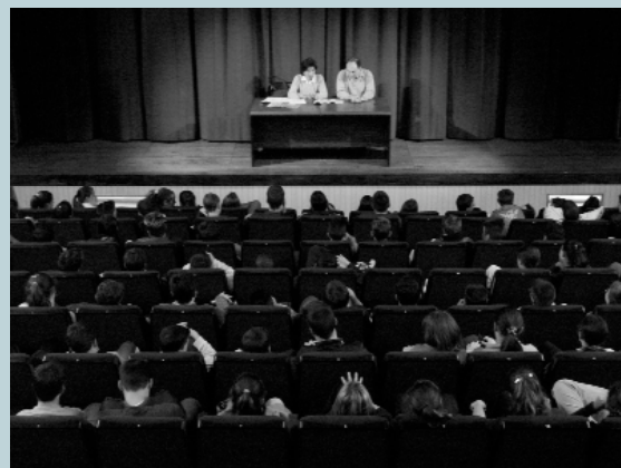
Xerrada "Formes de violència de gènere: violació, abús sexual i assetjament" dirigida a l'alumnat de l'Institut