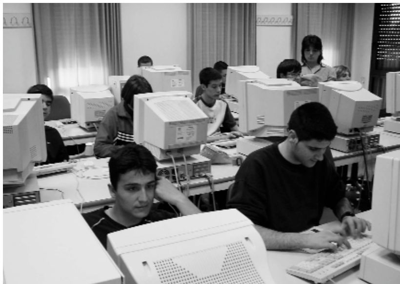
L'alumnat de la Casa d'Oficis a les aules d'informàtica del Centre de Formació