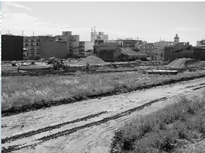
Nous carrers comencen a descobrir-se a la zona entre el carrer del Sol, Vistabella i la travessera de la Diputació