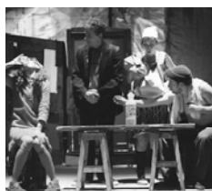
"Juana la loca", "Pan con pan" i "Mala leche" són les obres que tanquen aquesta temporada 2001-2002