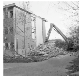
L'edifici de l'Institut, del qual sols es mantindrà part de l'estructura