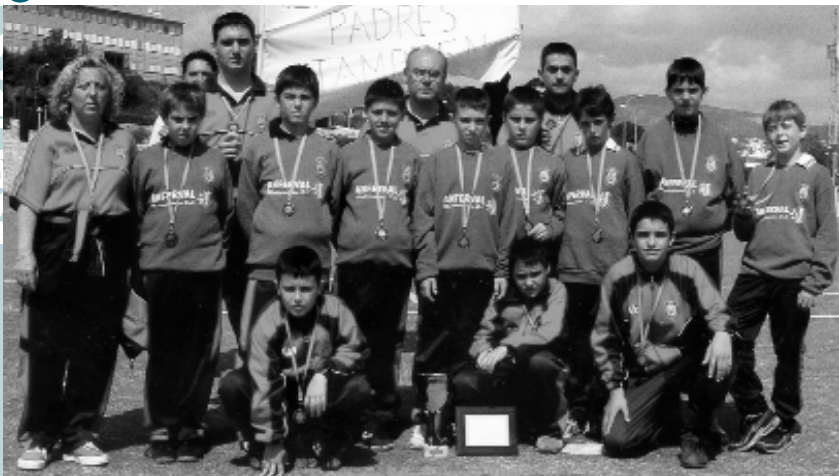
L'equip de Picanya amb les medalles i els trofeus aconseguits