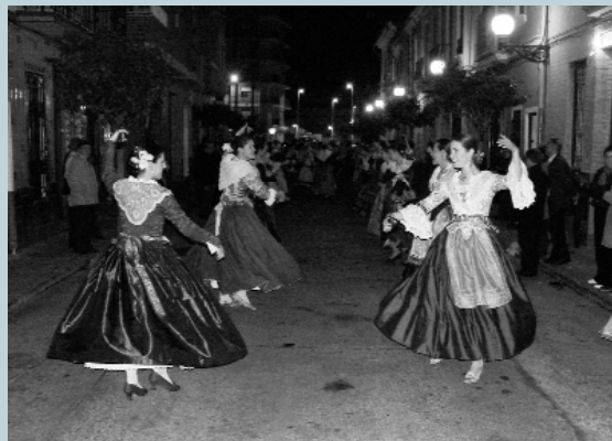
Primers metres del recorregut al carrer Sant Josep