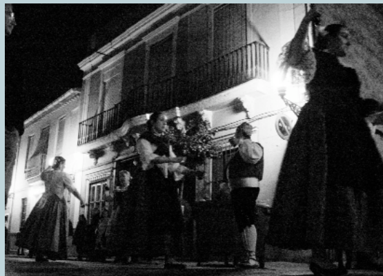
El grups de danses van avançant al ritme de tabals i dolçaines