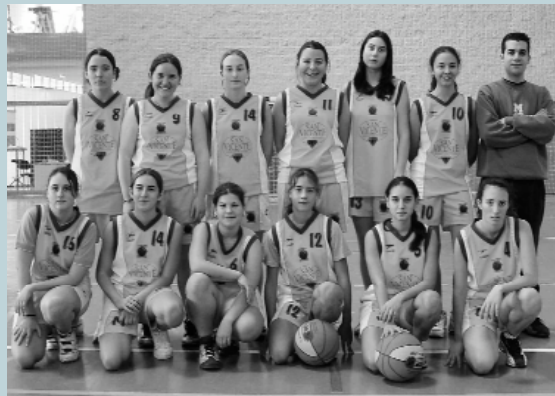
Equip cadet femení. Un equip amb una gran determinació i moltes ganes de treballar i millorar en aquest esport de la cistella. A mesura que vagen adquirint experiència milloraran els seus resultats.