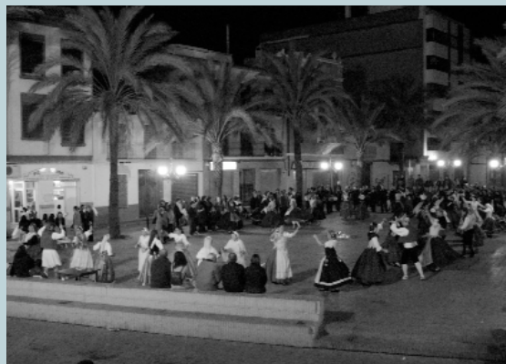
Arribada a la Pl. del País Valencià amb apoteosi final: ball en cercle cada vegada a un major ritme. Fins l'any que ve.