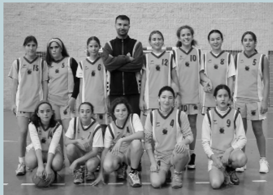
Equip infantil femení. L'equip amb més projecció i futur del club. Tot un exemple d'esforç per millorar que ja comença a donar els seus fruits i del qual s'espera molt a les properes temporades.

Estem davant d'una nova etapa per a aquest club que a més ja està treballant per aconseguir organitzar més equips per la temporada que ve. Si esteu interessats/des en l'esport de la pilota taronja podeu contactar amb el club als entrenaments (divendres des de les 18:30 h al Pavelló) o mitjançant del seu correu electrònic: club@picanyabasquet.net o el seu espai web: www.picanyabasquet.net