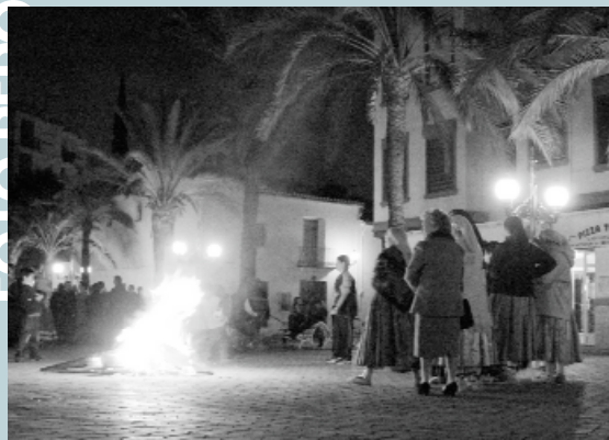
Foguera al centre de la plaça per a combatre el fred abans de l'inici

El passat 16 de febrer va tindre lloc una nova edició de l'Aplec de Dansà que cada any organitzen els grups Realenc i Carrasca i que convoca als nostres carrers un bon nombre de grups de danses tradicionals de les nostres rodalies. Ací us portem algunes imatges d'aquest vistós espectacle de música i ball.