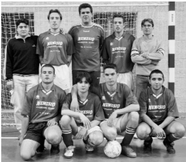
Els guanyadors: l'equip "Automóviles Nemesio"

El primer torneig de futbol sala celebrat al Pavelló va viure la seua cerimònia de doenda i lliurament de trofeus el passat 26 de març