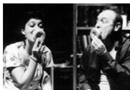
"Follow me" de l'Horta Teatre