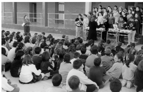
El cor del CP Ausiàs March va oferir un molt ben preparat mini-concert al pati del centre amb motiu del Dia de la Pau

Així és la nostre gent més jove, i per a demostrar-ho ací els teniu celebrant el Dia de la Pau i visitant l'autobús per a la integració al medi físic de les persones amb mobilitat reduïda.