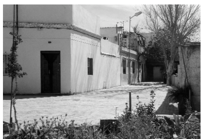
El carrer l'Ombra. Doble estrena: nom i paviment