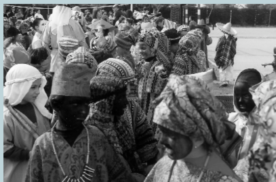
El fantàstic colorit africà va omplir els carrers del nostre poble