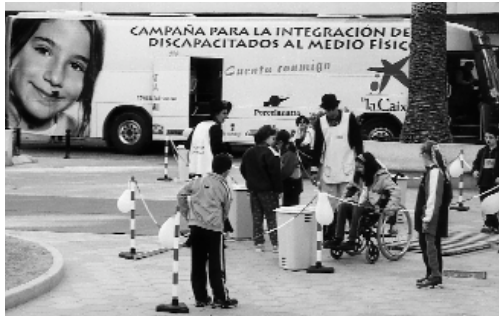
Grups d'escolars van visitar l'autobús per a la integració dels discapacitats on van ser conscients, mitjançant simulacions, de les dificultats que pateixen aquestes persones