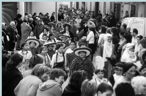
Des de Mèxic van arribar aquests personatges d'incalfidibles barrets