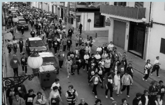
Pas pel carrer Colón, hi ha qui va corrent, hi ha qui camina, hi ha qui va xerrant... allò important és participar