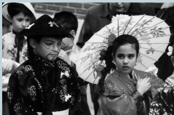
L'Orient llunyà també hi va estar representat