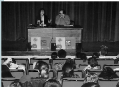
Presentació de la campanya: "El amor no es la ostia"