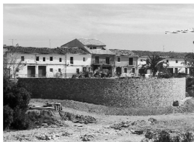
El mur de pedra de la zona d'esplai del carrer del Sol ja està finalitzat