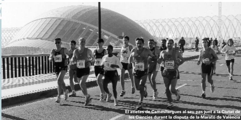
El atletes de Camesllargues al seu pas junt a la Ciutat de les Ciències durant la disputa de la Marató de València

Els huit atletes picanyers acabaren la prova en menys de tres hores i mitja