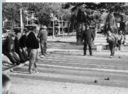
Un momento de la competición

Cal remarcar l'excel·lent ambient que va presidir aquesta activitat, sense caire competitiu, on allò important és el fet de l'encontre d'un bon grup de persones amb un mateix interès. Aquesta reunió és anual així que ja podem anar preparant la de l'any vinent.