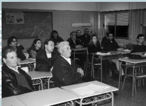
Una de les sessions del passat curs de producció integrada en citricultura