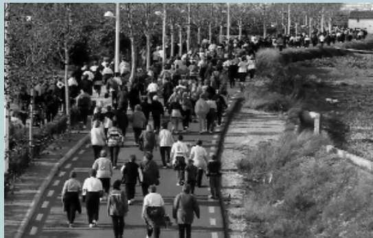
Espectacular aspecte del camí al Poliesportiu. Un autèntic riu de dones marxant cap a la línia de meta