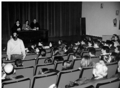
Alumnat de secundària durant la conferència sobre inserció laboral de la dona