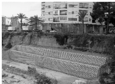
Mur de contenció sobre el barranc

Ací teniu algunes imatges de l'evolució d'algunes de les obres que, poc a poc, van millorant l'aspecte del nostre municipi. Noves zones enjardinades: Motor de Giner o Carrer del Sol, remodelació d'algunes existents: Parc Europa. Urbanització de l'últim carrer de terra que quedava al nostre poble: el carrer l'Ombra, millora de seguretat: murs sobre el barranc... i altres obres com el pavelló o el pont vell que ja es troben ben avançades, i que van millorant la qualitat de vida del nostre municipi.