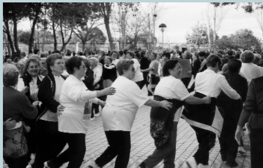
Finalment berenar, samarretes, festa i ball per a tancar el Recreo-Cross... fins l'any que ve!