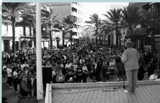
Salutació des de l'escenari de la Pl. del País Valencià per part de les Mestresses de Casa "Tyrius" a totes les participants

Com cada mes de març, i ja fa onze anys, l'associació de mestresses de casa Tyrius i l'Ajuntament de Picanya organitzen el Recreo-Cross de la Dona. Quasi 2.500 dones vingudes de tota la comarca de l'Horta es van donar cita a la plaça del País Valencià per a recórrer els 2 quilòmetres que separen la plaça del poliesportiu municipal. Una prova esportiva de característiques úniques (no hi ha cap altre event esportiu adreçat a dones amb una participació tan alta) que es converteix en un motiu de festa, d'encontre i de diversió en aquestes dates de reivindicació dels drets de les dones. La guanyadora va ser Fàtima Sierra del Barri del Crist, segona va ser Irene Mari de Picassent i tercera Esther Polo de Massanassa. La participant més veterana fou Carmen Gallardo de Quart de Poblet que va fer el recorregut als seus 85 anys d'edat.