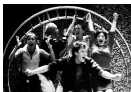
"Fuera de juego" de Dramatúrgia 2000