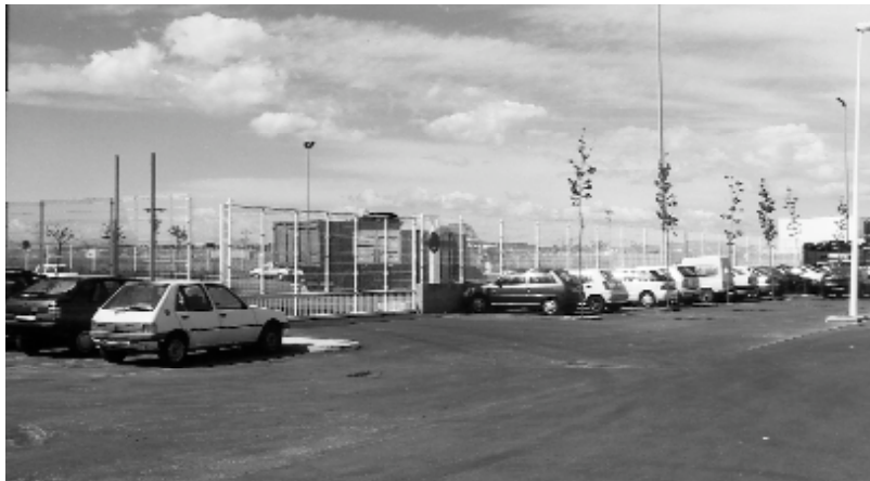
El nou aparcament per a camions del carrer Taronja ja està en funcionament

Des que el passat mes de febrer s'inaugurà el nou aparcament de camions al carrer Taronja, Picanya compta amb més de 100 places d'aparcament per a aquest tipus de vehicles, repartides en dos recintes diferents. Així, a l'aparcament situat al polígon de Raga, hi ha disponibles 43 places, mentre que a les instal·lacions recentment inau-