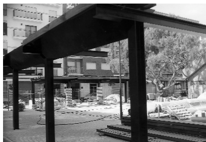
La plaça del Motor de Giner ja comença a deixar veure el seu nou aspecte