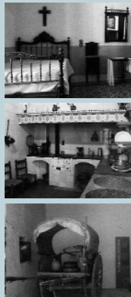
Diferents vistes del museu

Quan s'alça el sol la mare ja fa temps que està fent faena. Ja ha posat en marxa el forn per a fer el pa i ha tret l'aigua del pou perquè els homes i els xiquets puguen rentar-se. Els homes s'alcen i desdejunen abans d'eixir al pati a preparar les eines per a anar-se'n a treballar. Escenes com aquestes són molt fàcils d'imaginar quan es visita el Museu Comarcal de l'Horta Sud a Torrent. Aquest museu està instal·lat a "ca l'estudiant de Boqueta", una antiga casa de llauradors construïda en la primera dècada del segle XX i que ha estat comprada i restaurada per la Mancomunitat de l'Horta Sud. Els treballs de restauració de la casa s'han fet respectant tant la distribució original de les habitacions, com la decoració de sostres i parets.