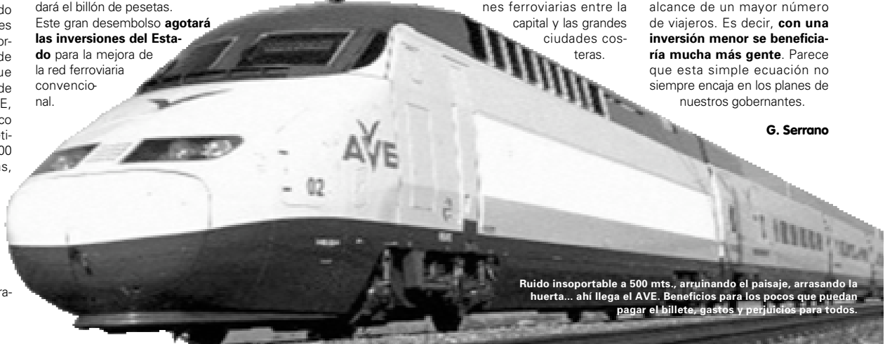
Ruido insoportable a 500 mts., arruinando el paisaje, arrasando la huerta... ahí llega el AVE. Beneficios para los pocos que puedan pagar el billete, gastos y perjuicios para todos.