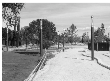
La zona del Parc Europa junt a Hospitalaris ja mostra les seues noves lluminàries