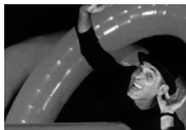
"Standby" de Marcel Gros