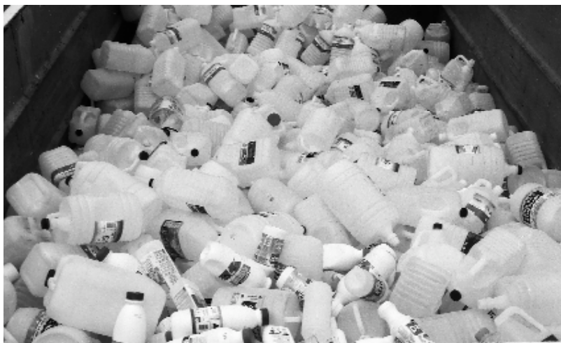
Contenedor per a la separació en origen del plàstic a l'ecoparc

La campanya, en les seues diferents formes, continua millorant resultats