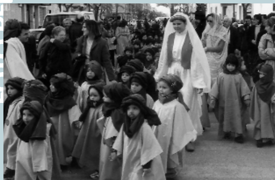
Homes i dones de blau provinents de l'àrid desert