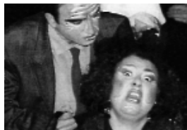
"El casament" de Cucurucú Teatre

Finalment, el mes de maig ens portarà "Follow me" de l'Horta Teatre, una comèdia antiromàntica on un taxista un tant tímida exigeix, d'una manera poc convencional, ser estimat per una cambrera de llengua afilada.