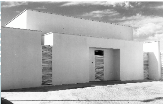
El nou local d'assaig del carrer Taronja ja està condicionat i preparat per acollir els diferents grups interessats a fer-ne ús