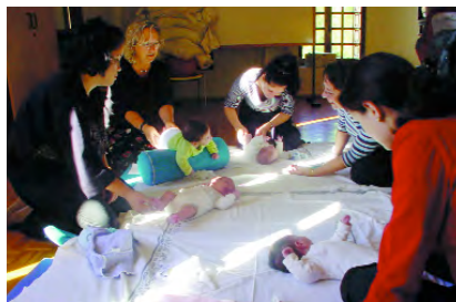
Desarrollo del programa en el Centro de Salud