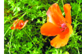
Horta del Realenc. El nostre pulmó verd que cal defensar

5. Principis de 2003. Adhesió d'algunes associacions de Picanya al Manifest per un AVE Soterrat de la Fundació de l'Horta Sud. A aquest manifest, s'hi han sumat en total 482 associacions de l'Horta Sud.