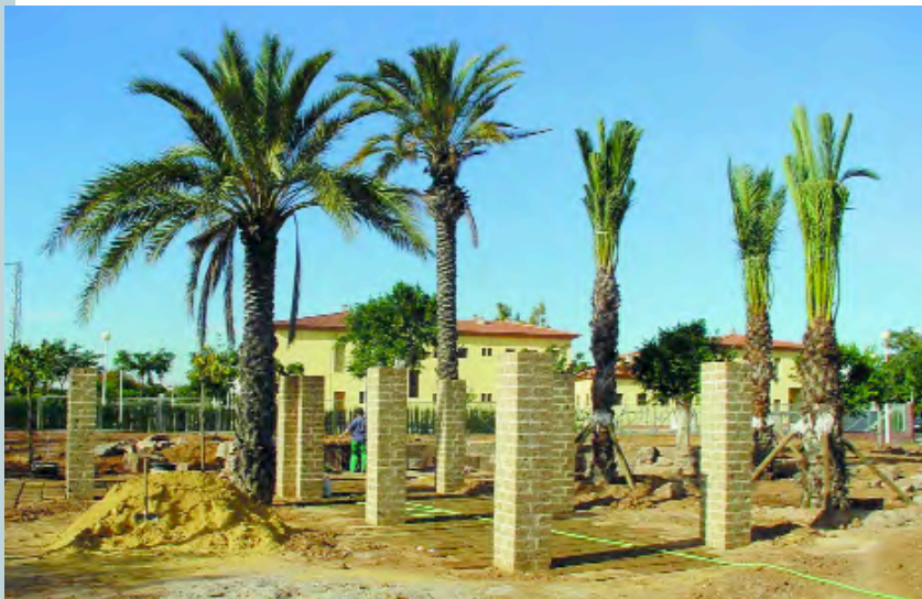
Nou jardí junt al Centre de Formació