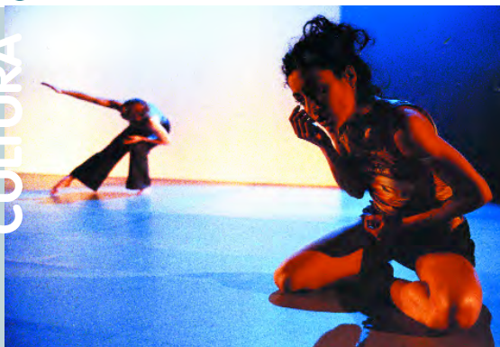
"La sonrisa de Cain" ens ofereix Tócame con tus ojos