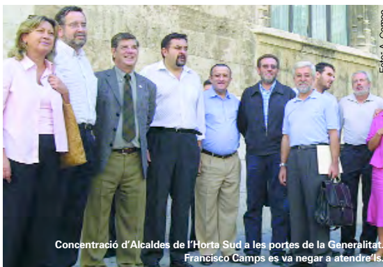
Concentració d'Alcaldes de l'Horta Sud a les portes de la Generalitat. Francisco Camps es va negar a atendre'ls.

Des de 1999 l'Ajuntament de Picanya ha realitzat múltiples accions demanant al Ministeri de Foment el soterrament del tren d'alta velocitat per a evitar la destrucció del Realenc i l'impacte negatiu en la població.