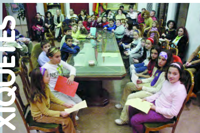
Els xiquets i les xiquetes del Consell al Ple Municipal

Ciprià sols va administrar 7 anys de la Llei. Segurament hauria d'haver-s'hi mantingut la mateixa espenta per tal que hui estiguérem en una situació millor, de més igualtat lingüística amb el castellà; en definitiva, d'una major normalitat lingüística als nostres pobles. Són molts els canvis que aquella decisió propicià, principalment el camí d'una reparació històrica, entre d'altres coses: la possibilitat d'una escola en valencià.