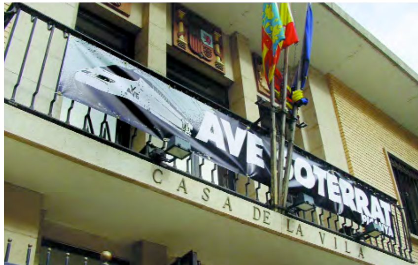
Pancarta de protesta al balcó de l'Ajuntament

2. Dia 11 d'abril de 2000. El ple aprova al·legacions contra l'AVE. Demana la retirada del projecte, així com la realització d'un nou estudi d'impacte ambiental que tinga en compte la qualitat de vida de les persones i la supervivència de l'horta de Picanya. L'Ajuntament demana també un projecte alternatiu: el soterrament de l'AVE per l'actual via Silla-València, tot desdoblant-ne