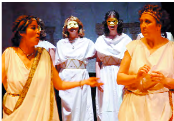
"EPA Teatre" i la seua representació d' Oh Zeus