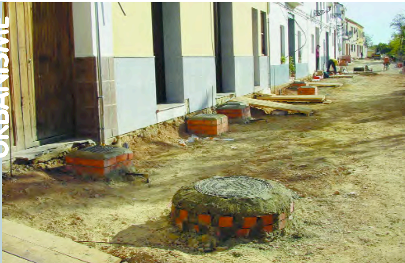
El carrer Almassereta en ple procés de millora