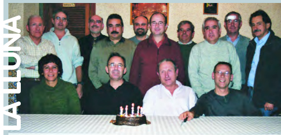
El grup davant el pastis de celebració dels 10 anys de tertúlies