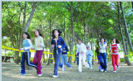
Un moment del recorregut