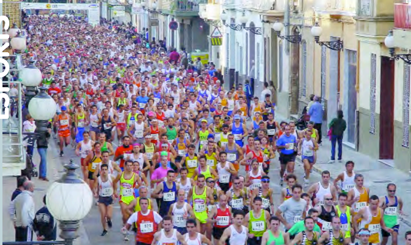
Eixida l'any passat al carrer Colón de Picanya