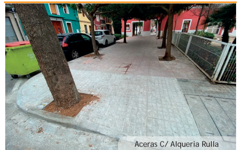
Aceras C/ Alqueria Rulla