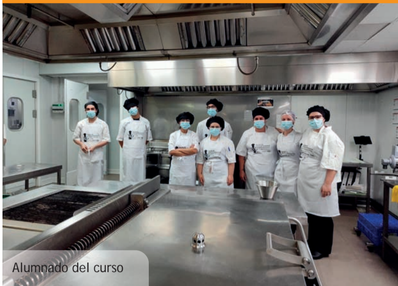
Alumnado del curso