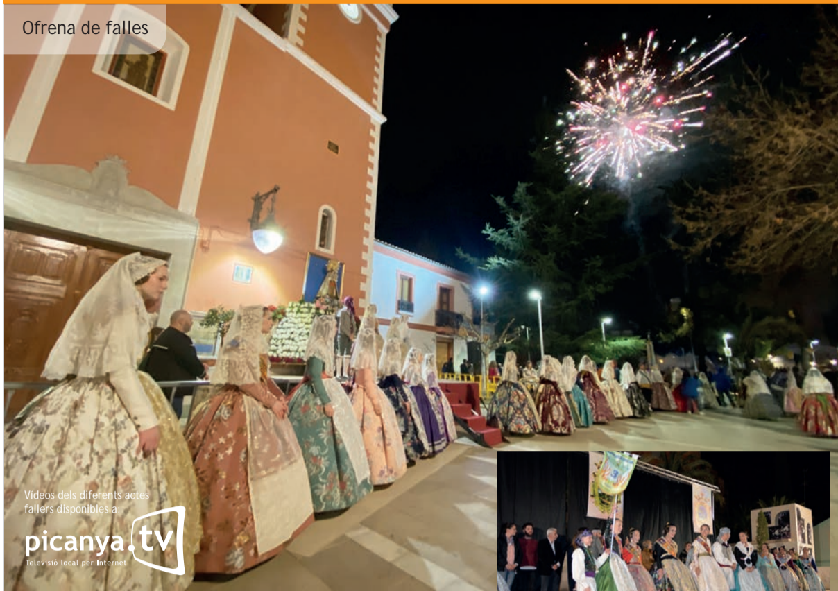
Videos dels diferents actes fallers disponibles a: