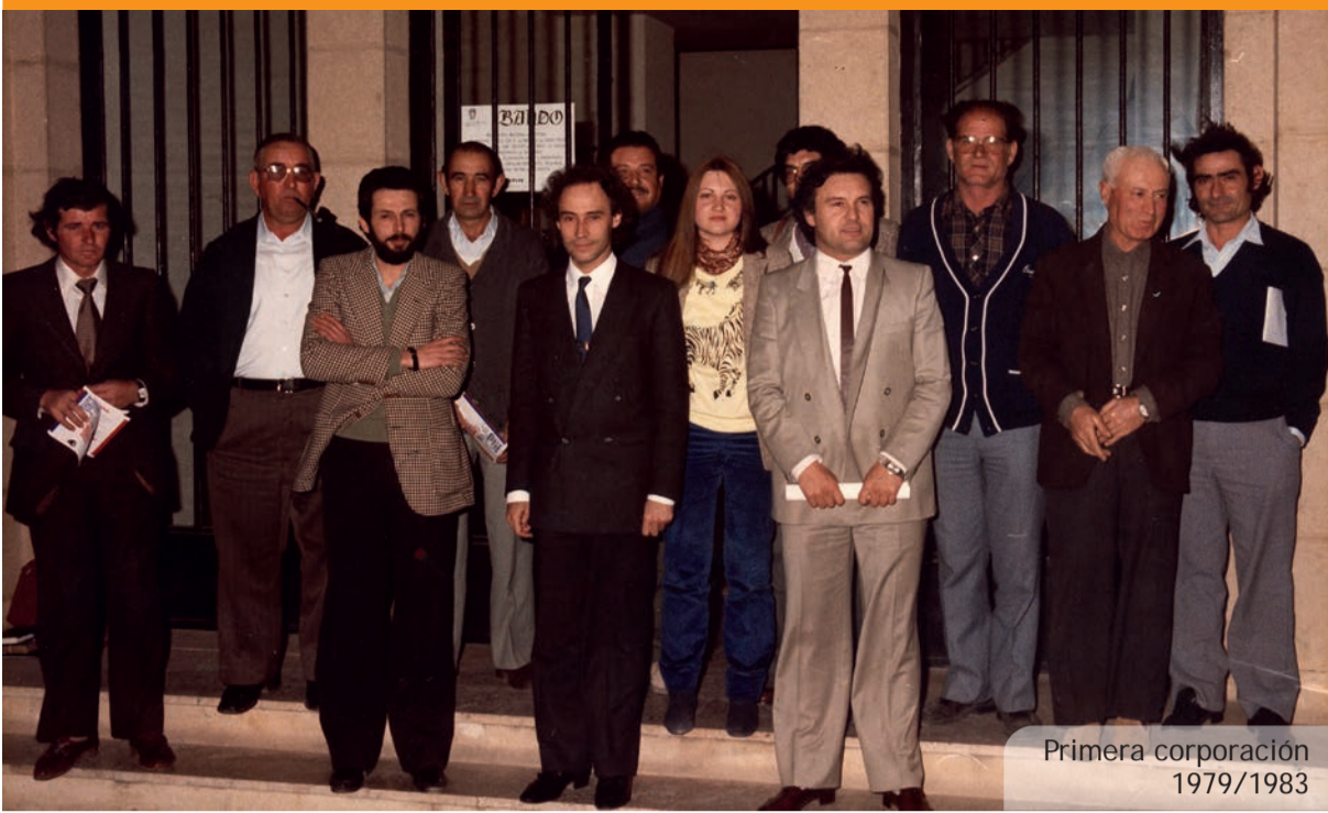
Primera corporación 1979/1983