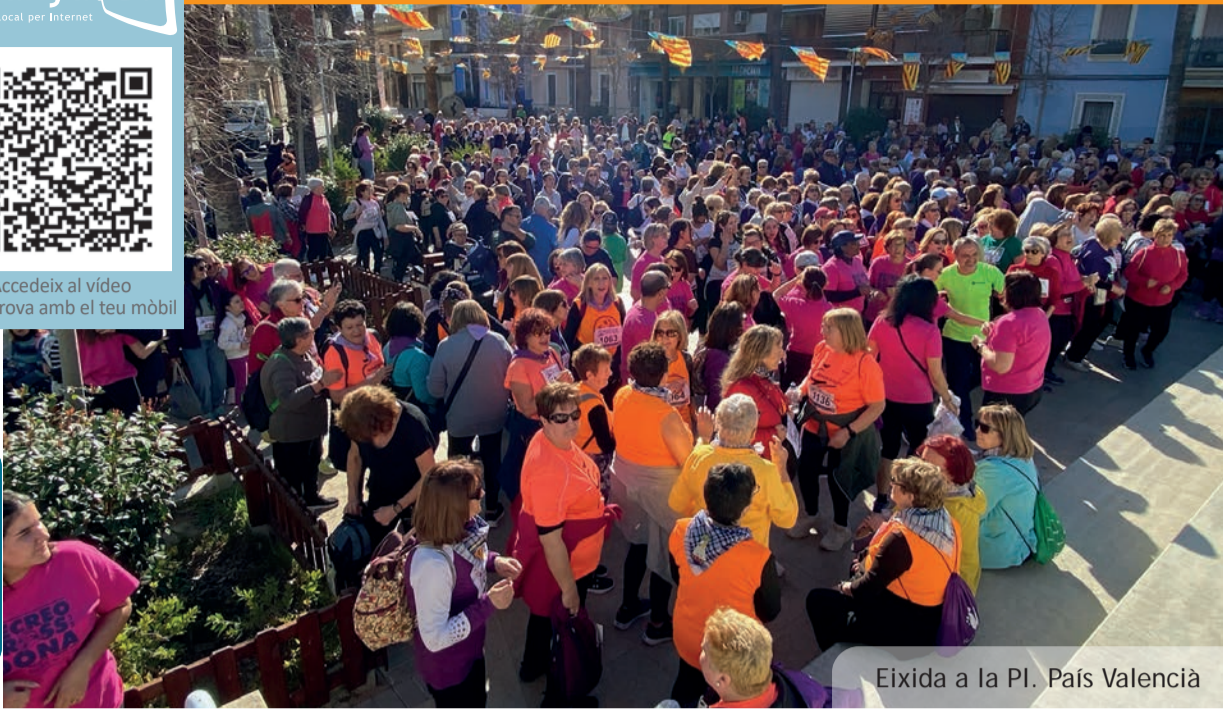
Eixida a la Pl. País Valencià

Accedeix al vídeo de la prova amb el teu mòbil