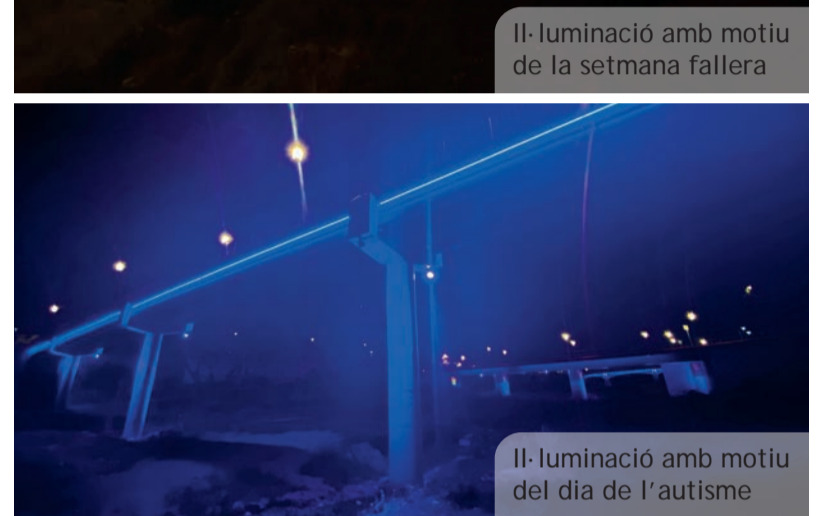
Il·luminació amb motiu del dia de l'autisme