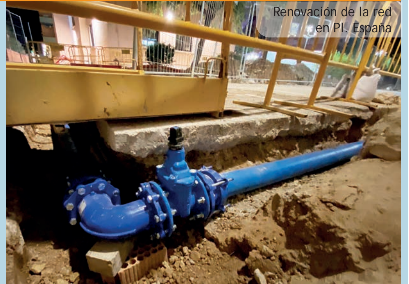
Renovación de la red en Pl. España