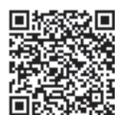
Accedeix al vídeo de l'acte amb el teu mòbil