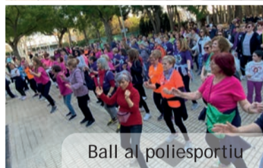
Ball al poliesportiu