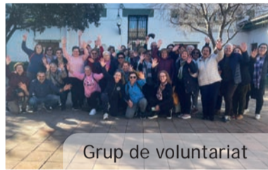
Grup de voluntariat

cià amb coreografies conjuntes dirigides des de l'escenari pel personal del Centre Esportiu Picanya per a continuar després amb un recorregut a peu fins al Poliesportiu on un xicotet berenar i el regal de la samarreta commemorativa espera a les participants. De nou el ball, posa el punt i final a esta activitat destinada a promoure la sociabilització i l'activitat esportiva entre les dones.