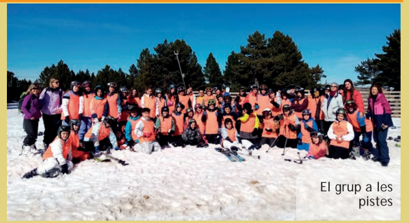
El grup a les pistes