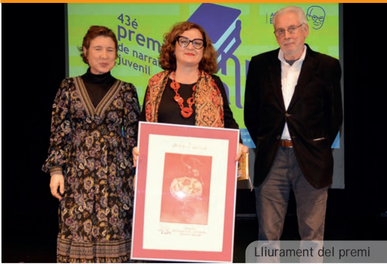
Lliurament del premi