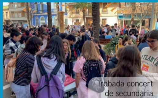
Trobada concert de secundària

22 de març TROBADA-CONCERT DE SECUNDÀRIA Plaça del País Valencià