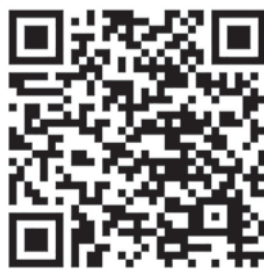
Accedeix a l'apartat "Evolució històrica" amb el teu mòbil

Un recorregut que fins i tot ens permet descobrir espais que s'han renovat en diferents ocasions (com ara carrers o places o instal·lacions com ara l'Institut o el Centre de Salut) o situar fetes com el naixement de la campanya "Crèixer junts millor" o l'arribada dels contenidors de residus urbans. Un recorregut fonamental per a entendre el valor clau de la democràcia local en l'evolució del nostre poble.