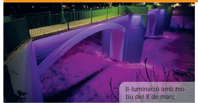
Il·luminació amb motiu del 8 de març