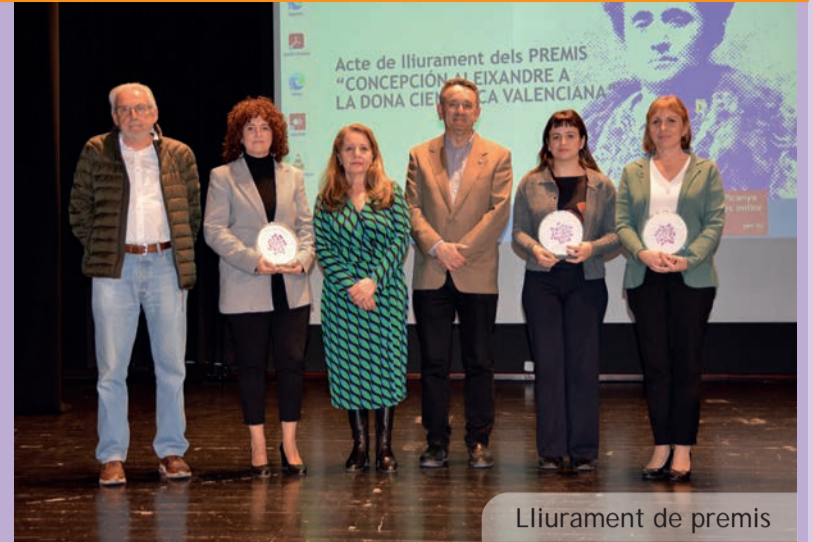
Lliurament de premis