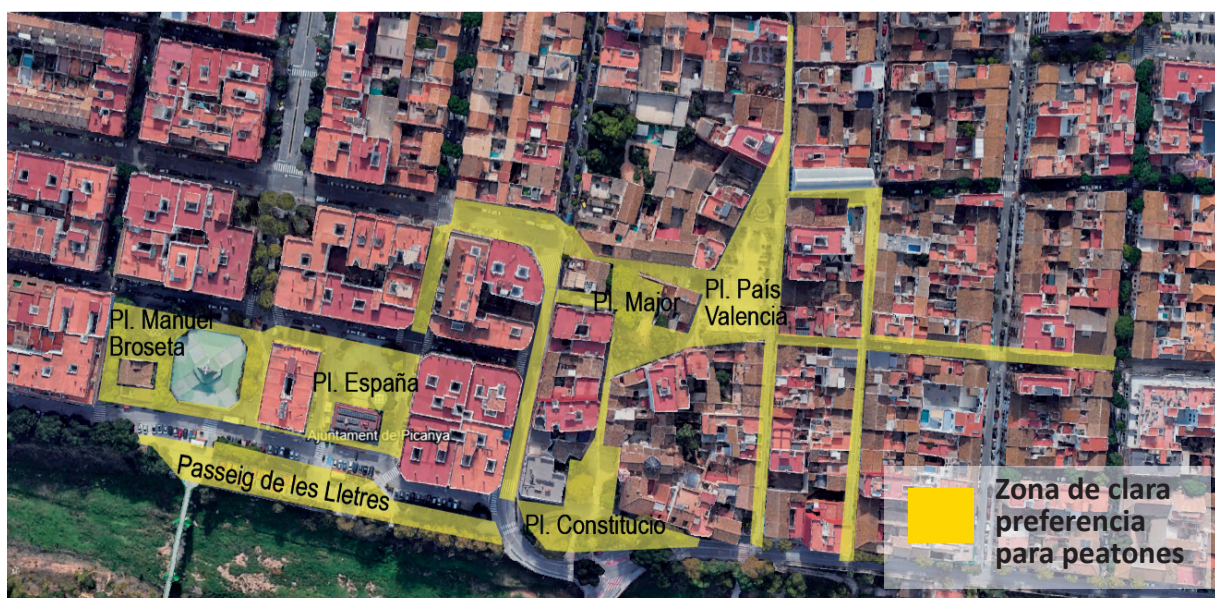
Zona de clara preferencia para peatones

cio peatonal de Plaza España y calles adyacentes (calle Mercat). De estos fondos, los servicios municipales han conseguido que una gran parte (1.506.327,13€) provengan de la subvención del Ministerio de Industria, Comercio y Turismo, enmarcada en el Plan de Recuperación, Transformación y Resiliencia de la Unión Europea.