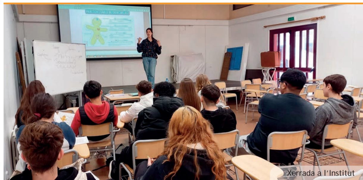
Xerrada a l'Institut

8. El lliurament dels premis es farà públic al Centre Cultural de Picanya el 28 de maig de 2024.