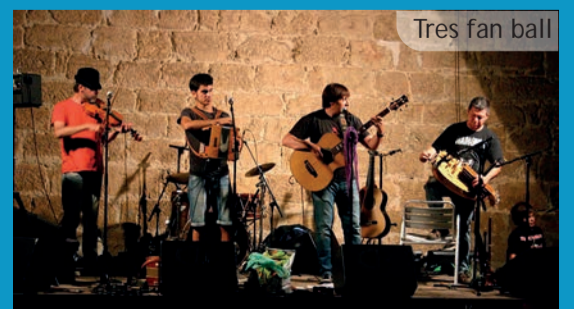
Tres fan ball