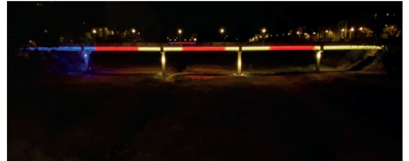
Il·luminació amb motiu de la setmana fallera