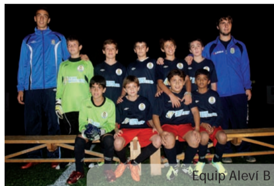
Equip Aleví B