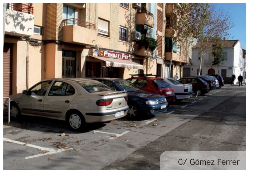
C/ Gómez Ferrer

volupat en obres anteriors amb la creació de passos elevats per a vianants, molt ben valorats per la població i la conseqüent eliminació d'entrebancs arquitectònics, substitució de paviments, millores als escocells dels arbres, etc.