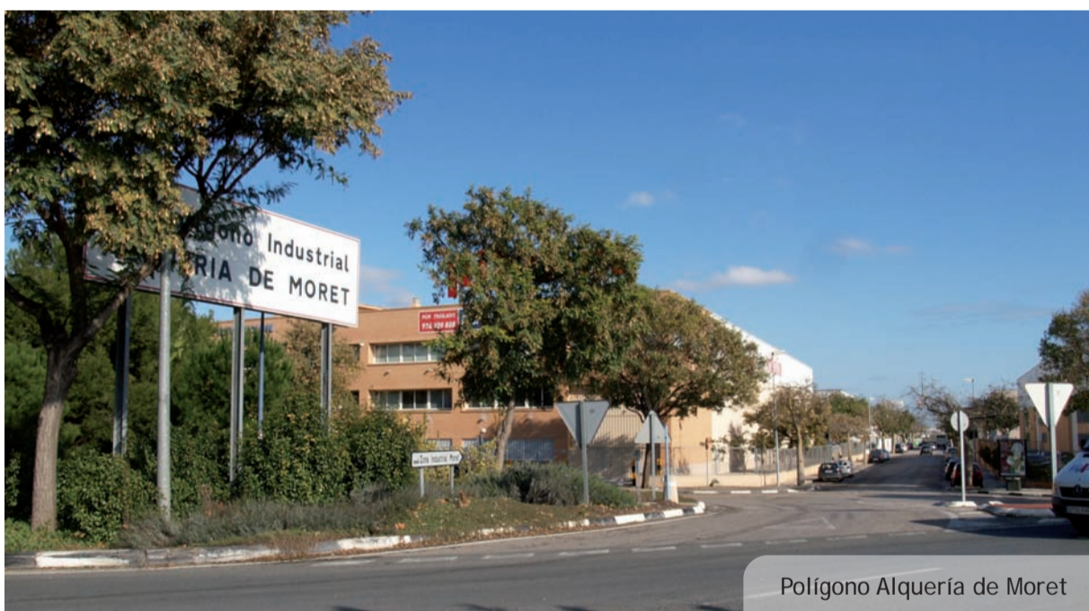
Polígono Alqueria de Moret

Aquest programa està organitzat per l'Agència de Desenvolupament Local i subvencionat pel SERVEF i pel Fons Social Europeu. L'objectiu final d'aquest programa formatiu és que les alumnes participants puguin adquirir una bona capacitat professional i millorar les possibilitats d'incorporar-se al mercat laboral.