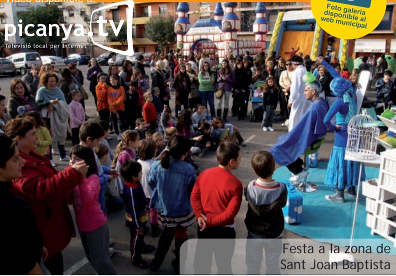
Festa a la zona de Sant Joan Baptista