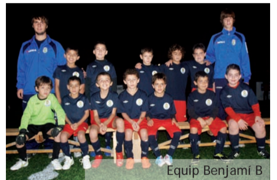
Equip Benjamí B