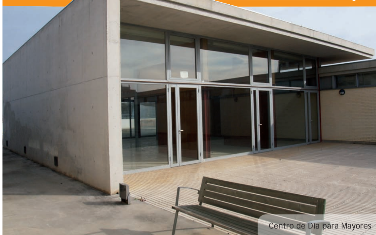
Centro de Día para Mayores

lencià amb l'acompanyament de la música del tabal i la dolçaina on l'acte conclourà amb un ball col·lectiu anomenat Fandango de germanor que plena la Plaça de color i calor.