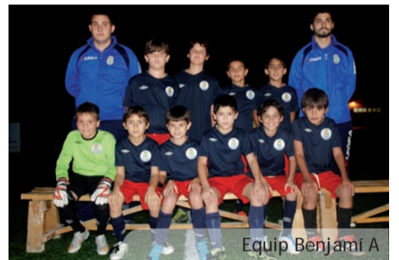
Equip Benjamí A