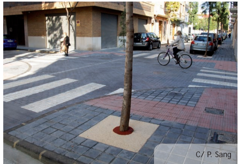
C/ P. Sang

També s'ha previst que, al voltant de la zona d'accés limitat s'instal·len zones de càrrega i descàrrega que permetran l'estacionament de vehicles relacionats amb el subministrament als comerços localitzats a l'interior d'aquesta àrea.