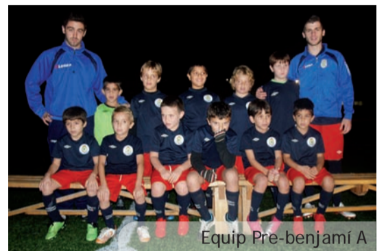
Equip Pre-benjamí A