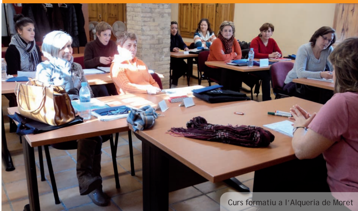
Curs formatiu a l'Alqueria de Moret