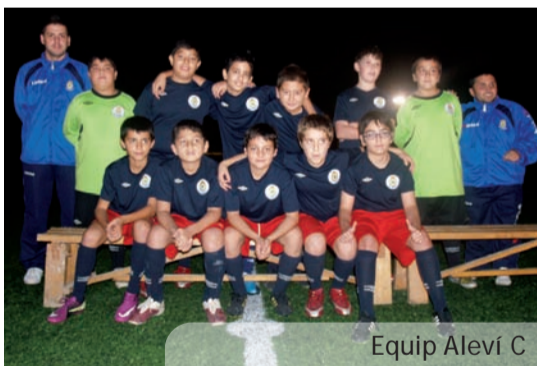
Equip Aleví C