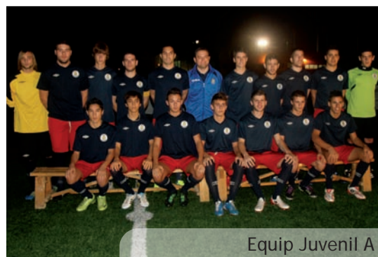
Equip Juvenil A