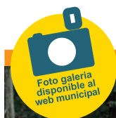
Foto galeria disponible al web municipal