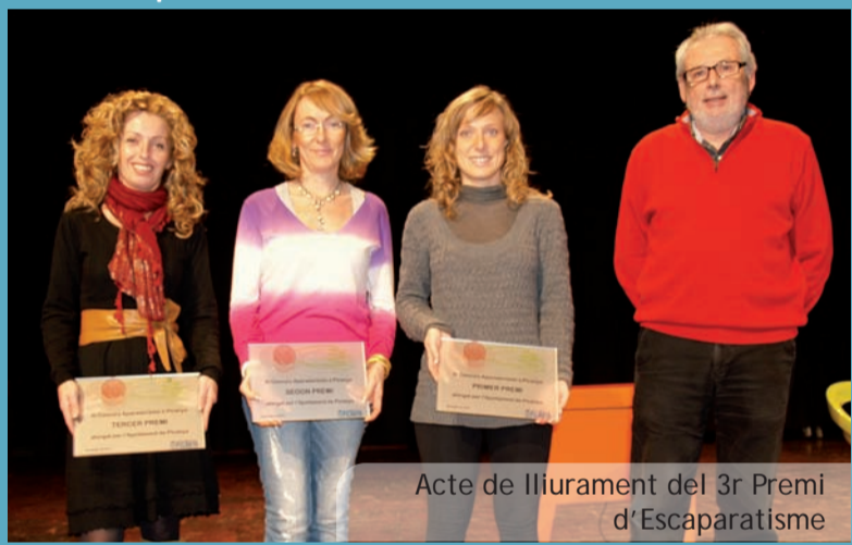
Acte de lliurament del 3r Premi d'Escaparisme