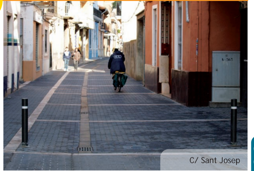
C/ Sant Josep