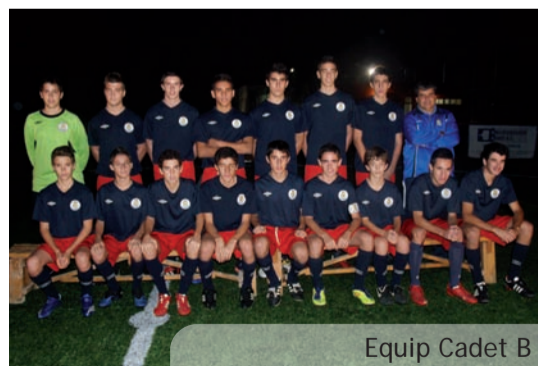
Equip Cadet B