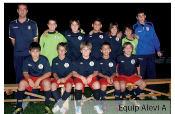
Equip Aleví A