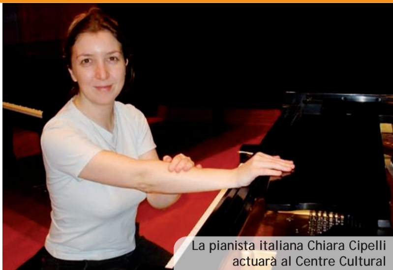
La pianista italiana Chiara Cipelli actuarà al Centre Cultural