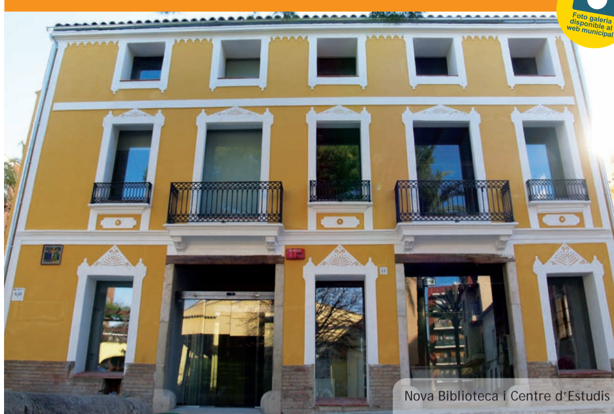
Nova Biblioteca i Centre d'Estudis