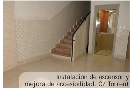
Instalación de ascensor y mejora de accesibilidad. C/ Torrent

Ahora el Servicio de Vivienda junto al departamento de Urbanismo serán los encargados del asesoramiento y gestión de ayudas de aquellos vecinos y comunidades que quieran acogerse a las ayudas del Plan ARI y mejorar así sus viviendas. Un nuevo proyecto que, sin duda, seguirá mejorando la calidad de vida de vecinos y vecinas.