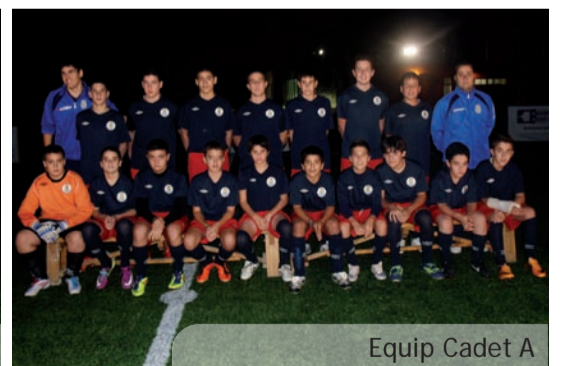
Equip Cadet A