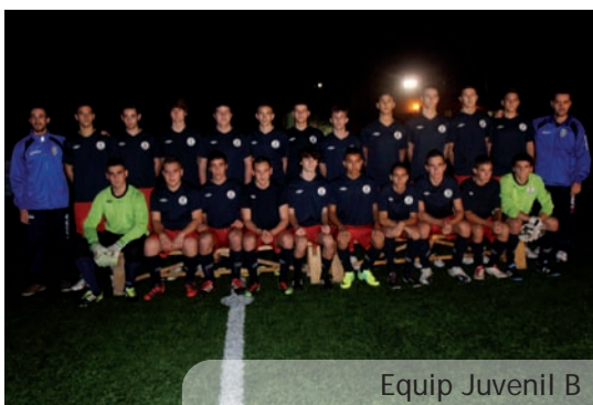
Equip Juvenil B