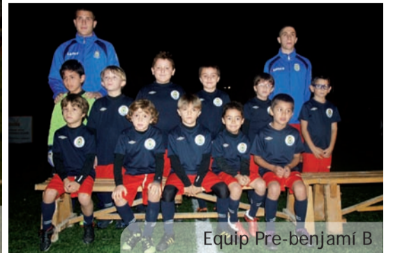
Equip Pre-benjamí B