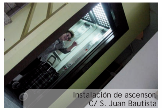
Instalación de ascensor. C/ S. Juan Bautista