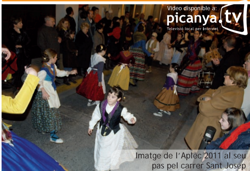
Imatge de l'Aplec 2011 al seu pas pel carrer Sant Josep

de la vida actual d'una manera molt personal entre colors càlids i llums i ombres.