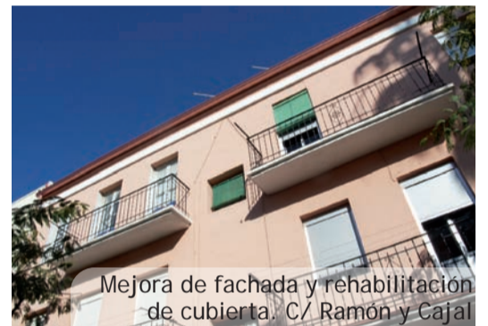
Mejora de fachada y rehabilitación de cubierta. C/ Ramon y Cajal