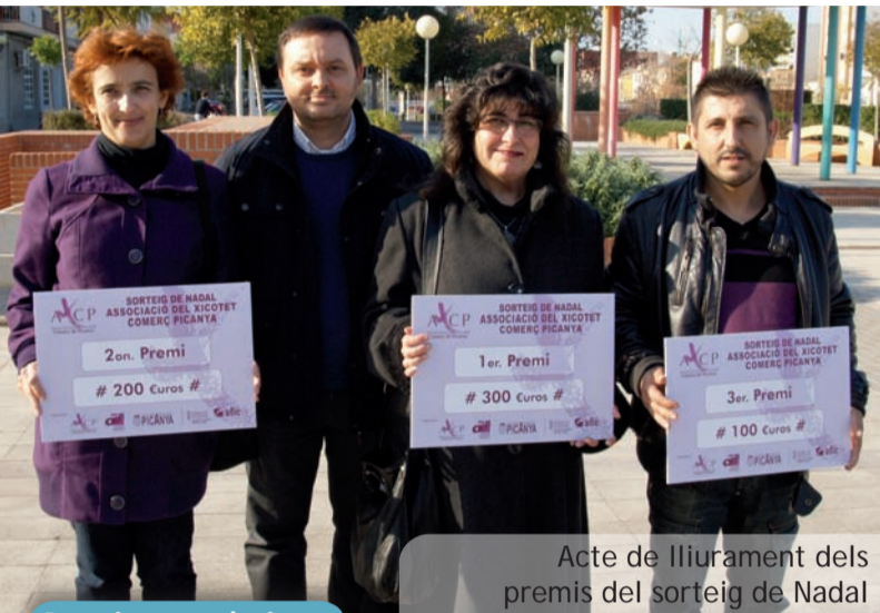
Acte de lliurament dels premis del sorteig de Nadal