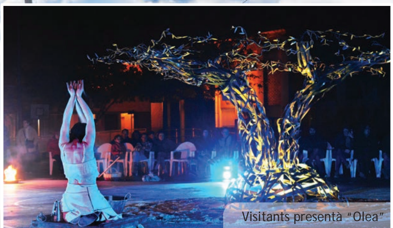
Visitants presenta "Olea"