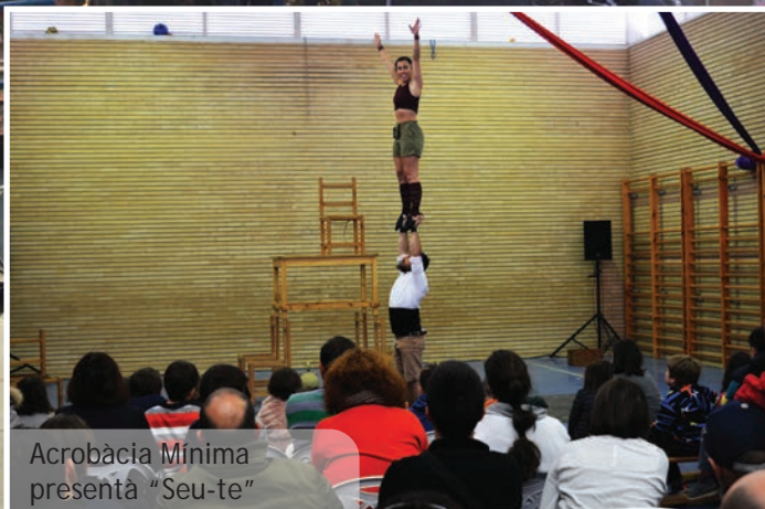
Acrobacia Mínima presenta "Seu-te"