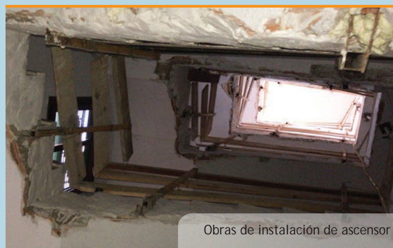
Obras de instalación de ascensor

La nueva sala ganará en cuanto a capacidad, comodidad, accesibilidad y versatilidad de uso