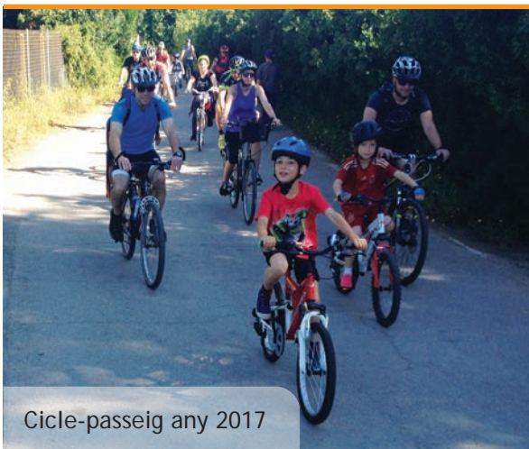
Cicle-passeig any 2017

Per quart any, l'Ajuntament de Picanya, amb la col·laboració del club Camesllargues d'atletisme també va organitzar el Corre-Cross de la Dona una cursa atlètica per a dones majors de 14 anys amb un recorregut de 4 Km. i arribada al Poliesportiu municipal de Picanya. Hi hagué regal de samarreta commemorativa de la cursa per a totes les participants i berenar a l'arribada al Poliesportiu per a les prop de 70 dones participants.