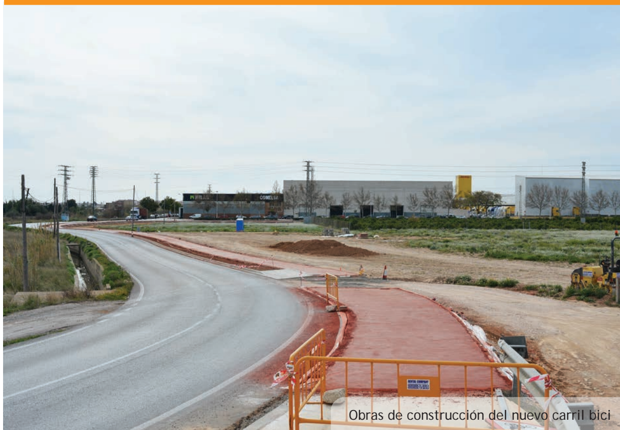
Obras de construcción del nuevo carril bici