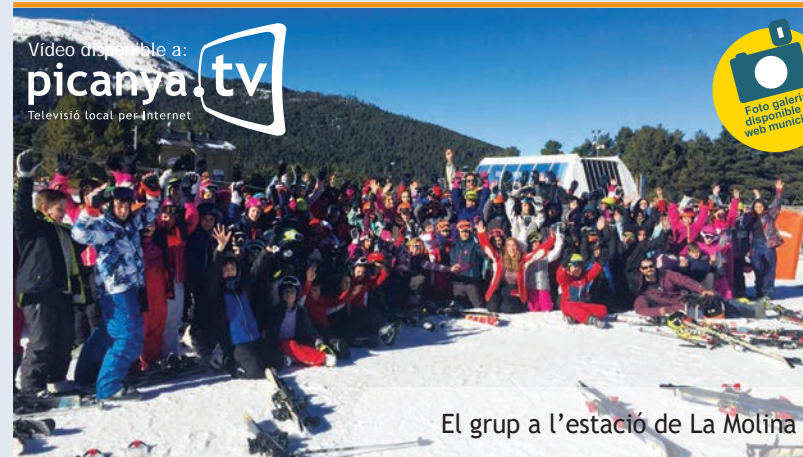
El grup a l'estació de La Molina

Amb 24 victòries en 25 partits disputats i quan encara faltaven diverses jornades per al final de lliga, l'equip amateur (equip sènior) del CF Benimar-Picanya s'ha fet amb el títol de campió de lliga. Un primer èxit per a este equip creat esta temporada que, de ben segur, no serà l'últim.