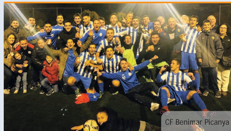
CF Benimar Picanya

Els picanyers han aconseguit el títol amb una espectacular actuació amb 19 victòries per cap derrota en el que va de temporada, cosa que els ha permès celebrar la victòria quan encara faltaven cinc jornades per a acabar esta lliga 2017-2018, que ja deixa un nou gran títol oficial a les vitrines del Picanya Bàsquet.