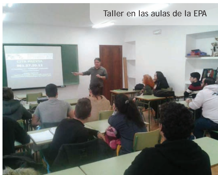
Taller en las aulas de la EPA

La Mancomunitat Intermunicipal de l'Horta Sud está impartiendo este tipo de formación, durante este curso académico, al alumnado de las Escuelas para Personas Adultas (EPAs) de l'Horta Sud. Estas charlas y talleres están destinadas a dinamizar y aunar los esfuerzos en la comarca en materia de autoempleo e inserción sociolaboral de las personas jóvenes.