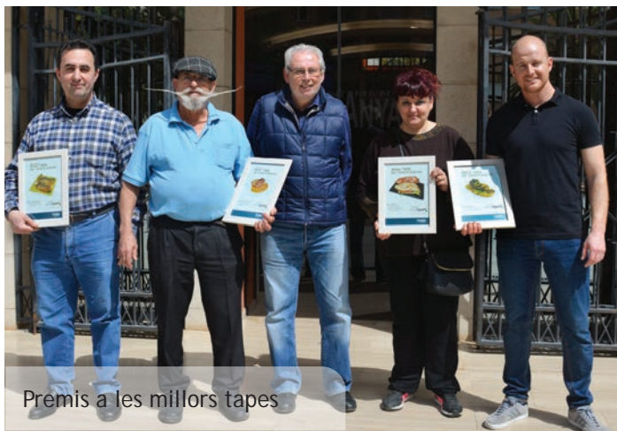
Premis a les millors tapes