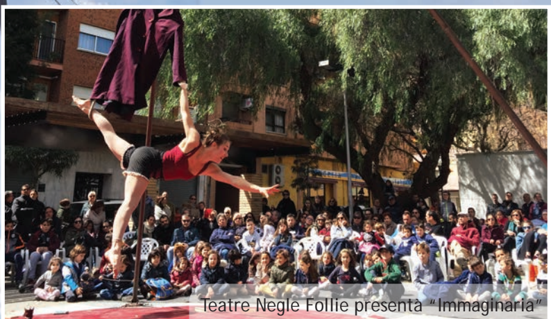
Teatre Negle Follie presenta "Immaginaria"

tacles oferits en esta GiroscòPICA 2018, des d'aquells destinats a un públic més familiar i majoritari fins les propostes més innovadores i arriscades. Així, esta Fira Valenciana d'Arts de Carrer també va complir amb un dels seus objectius fonamentals: seduir a nous públics i animar el gust pel teatre i la creació artística.