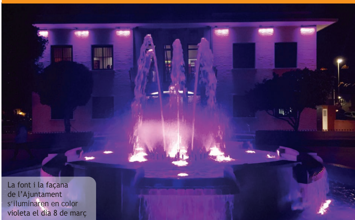
La font i la façana de l'Ajuntament s'iluminaren en color violeta el dia 8 de març