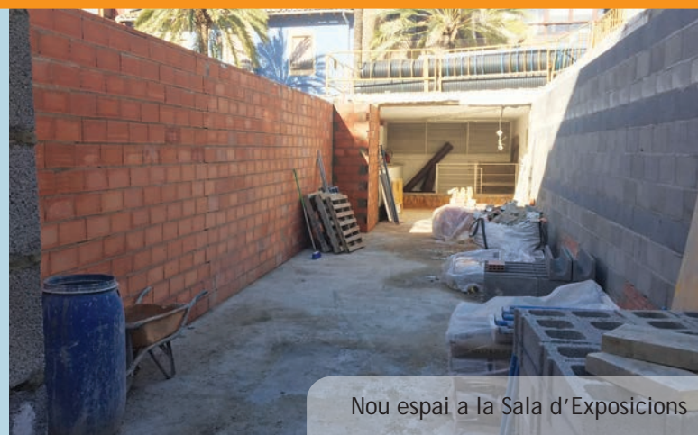
Nou espai a la Sala d'Exposicions