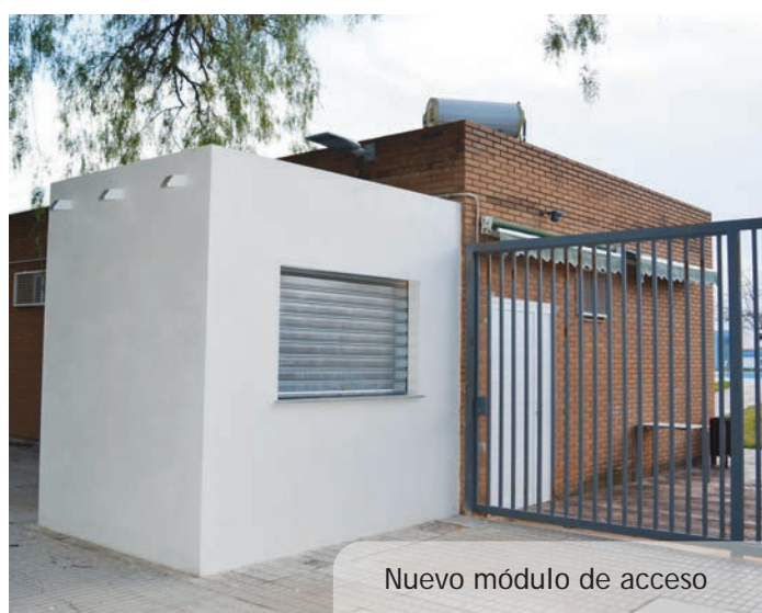
Nuevo módulo de acceso

Desde la reforma integral de la piscina del Polideportivo Municipal y su transformación en zona de piscinas lúdicas, el número de personas usuarias de estas instalaciones ha crecido de forma muy significativa verano tras verano. Por esta razón, se ha aprovechado el parón invernal de la instalación para la construcción de un nuevo módulo en la zona de acceso destinado a mejorar el procedimiento de venta de entradas y la agilidad y seguridad de todo el proceso. Esta mejora sin duda, repercutirá en una mayor comodidad tanto para los y las bañistas como para el personal que trabaja en la instalación.