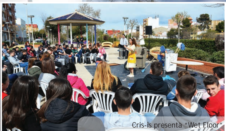
Cris-is presenta "Wet Floor"