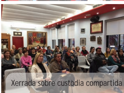
Xerrada sobre custòdia compartida