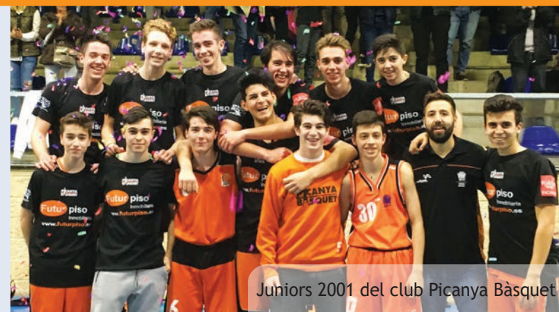
Juniors 2001 del club Picanya Bàsquet