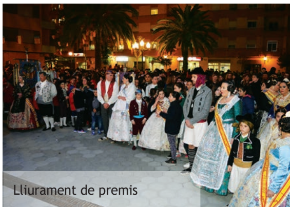
Lliurament de premis

Les obres de reforma de la Plaça del País Valencià també van obligar a alguns canvis i actes com ara la Cridà o el lliurament de premis van haver de traslladar-se a la Plaça Espanya. Superades totes les dificultats, el fet és que picanyeres i picanyers van poder disfrutar un any més d'unes magnífiques Festes Falleres.