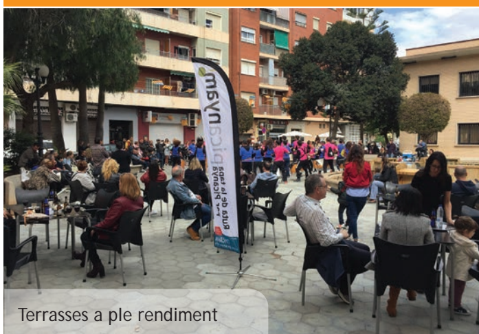
Terrasses a ple rendiment