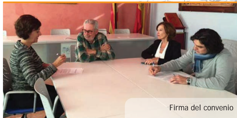
Firma del convenio