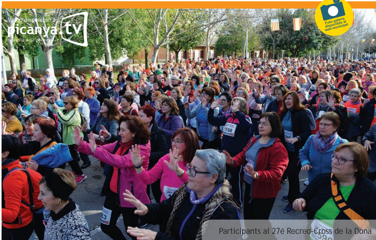
Participants al 27é Recreo-Cross de la Dona