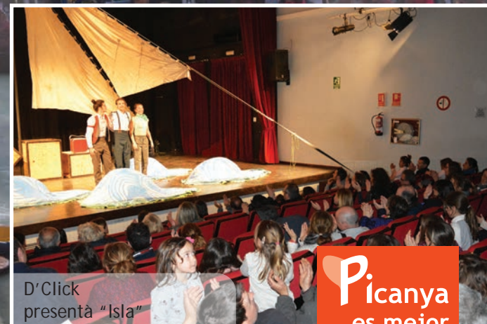
D'Click presenta "Isla"