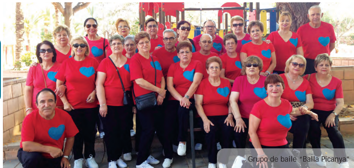
Grupo de baile "Balla Picanya"