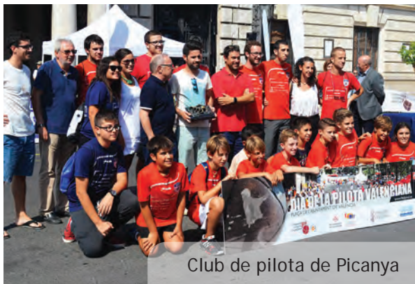
Club de pilota de Picanya