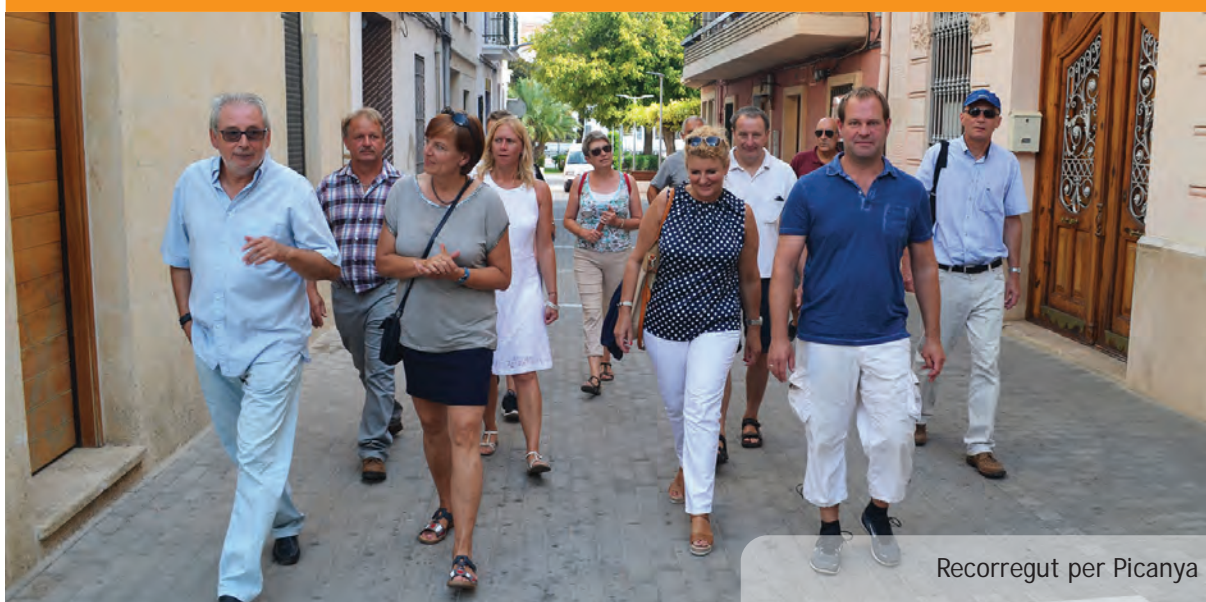
Recorregut per Picanya