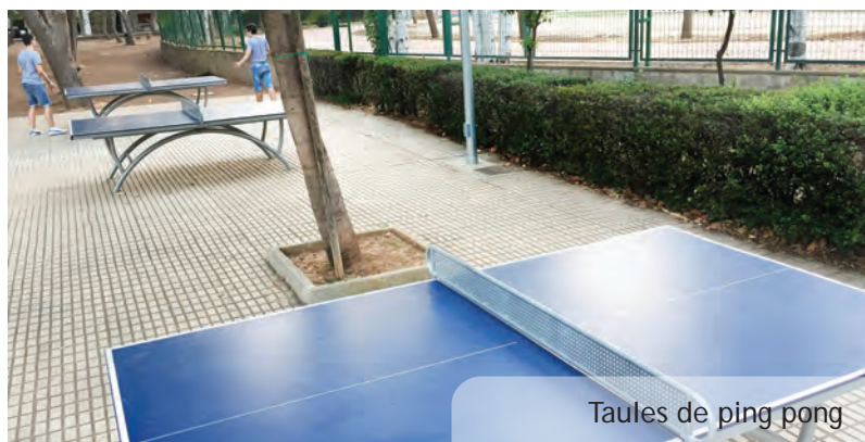
Taulas de ping pong

E l diumenge 11 de setembre, el món de la pilota valenciana, va viure el seu dia gran a la plaça de l'Ajuntament a València. Allà estigué present el Club de Pilota Valenciana del nostre poble per a rebre, per part de la Federació de Pilota de la Comunitat Valenciana, el premi "Paco Cabanes" a la promoció d'este esport. Un esport que a Picanya sols havia sobreviscut gràcies a les escoles esportives i les partides organitzades des de l'Ajuntament i que, ara, ja compta amb un club ben actiu que se suma al molt extens teixit esportiu picanyer.