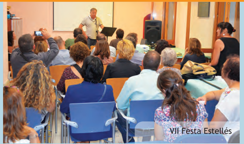
VII Festa Estellés

una taula analítica per temes i un índex onomàstic amb el nom de les persones recollits a les actes. Es poden recollir exemplars d'este llibre (fins exhaurir existències) a les oficines de l'Ajuntament.