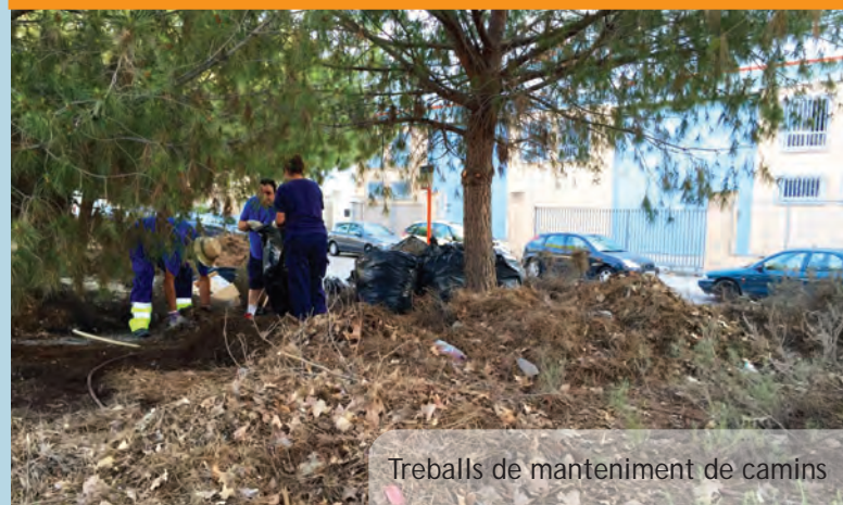
Treballs de manteniment de camins