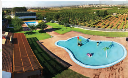
Colze a colze amb els Ajuntaments

Remodelació integral de la piscina esportiva descoberta del Poliesportiu de Picanya i transformació en piscines lúdiques, ampliació de làmina d'aigua i instal·lació de diferents jocs d'aigua.