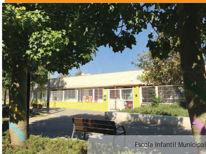
Escola Infantil Municipal