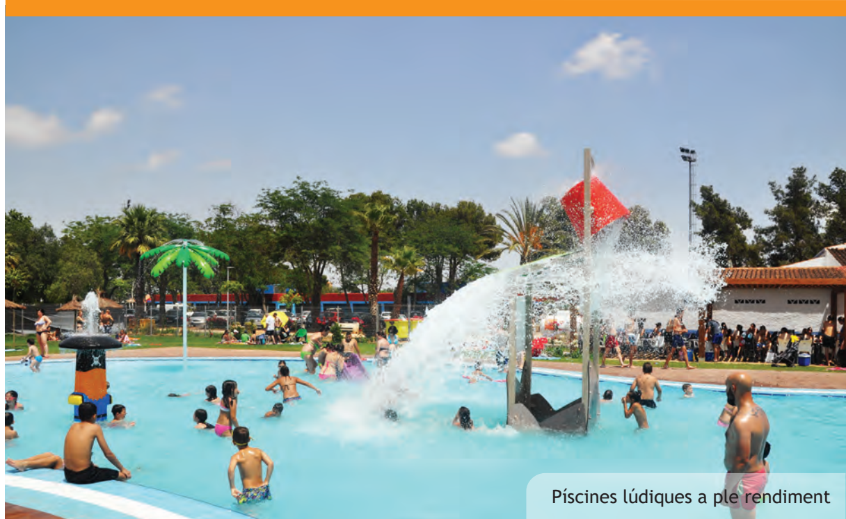
Piscines lúdiques a ple rendiment