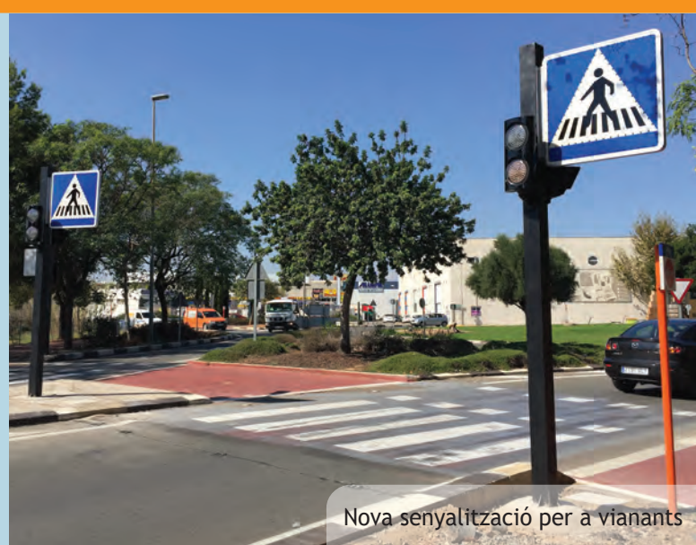
Nova senyalització per a vianants