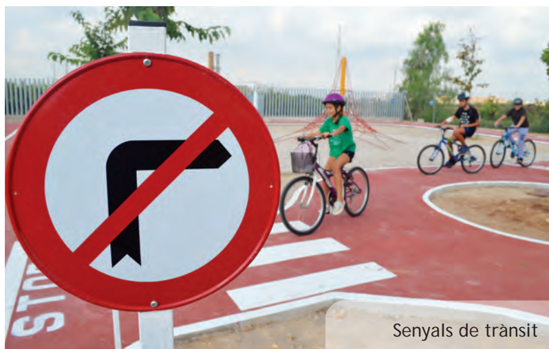
Senyals de trànsit