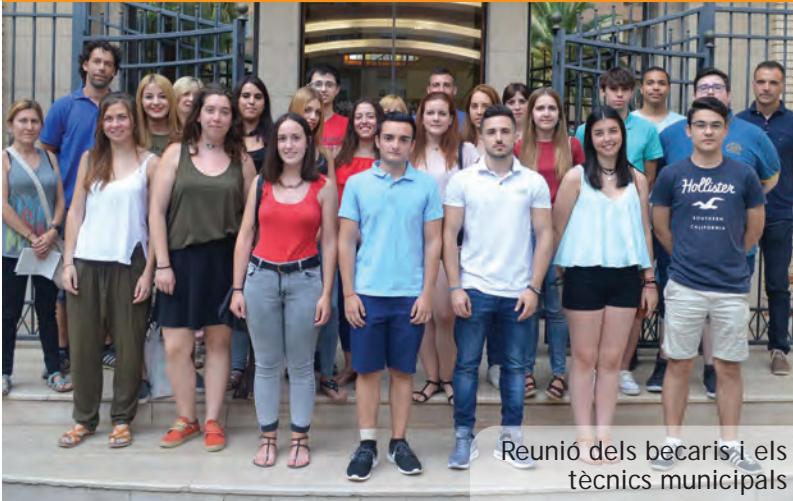
Reunió dels becaris i els tècnics municipals