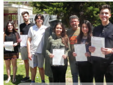
Alumnat 2n batxillerat