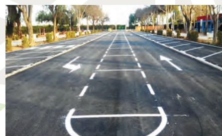
Colze a colze amb els Ajuntaments

Reordenació i millores als aparcaments i zona de la pinada. Instal·lació de jocs i altres elements.