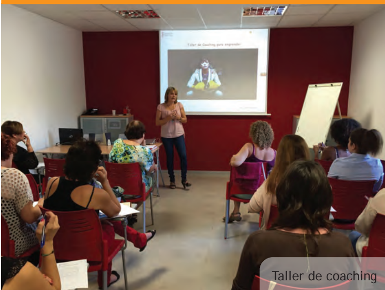
Taller de coaching