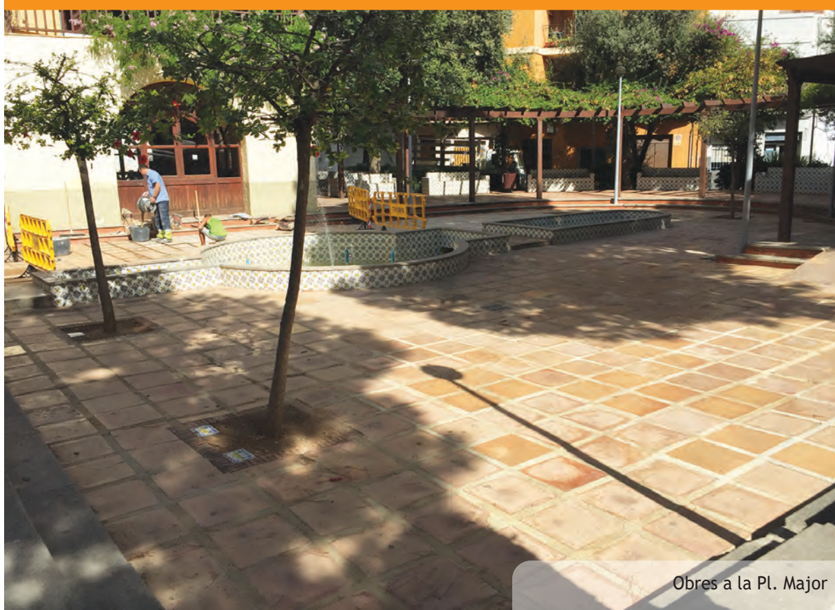
Obres a la Pl. Major