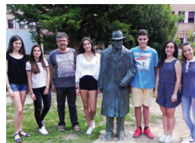
Alumnat 4t ESO