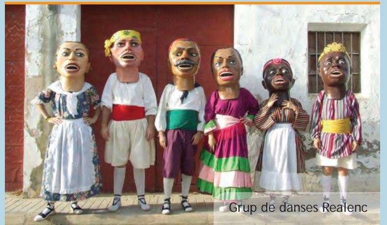
Grup de danses Realenc