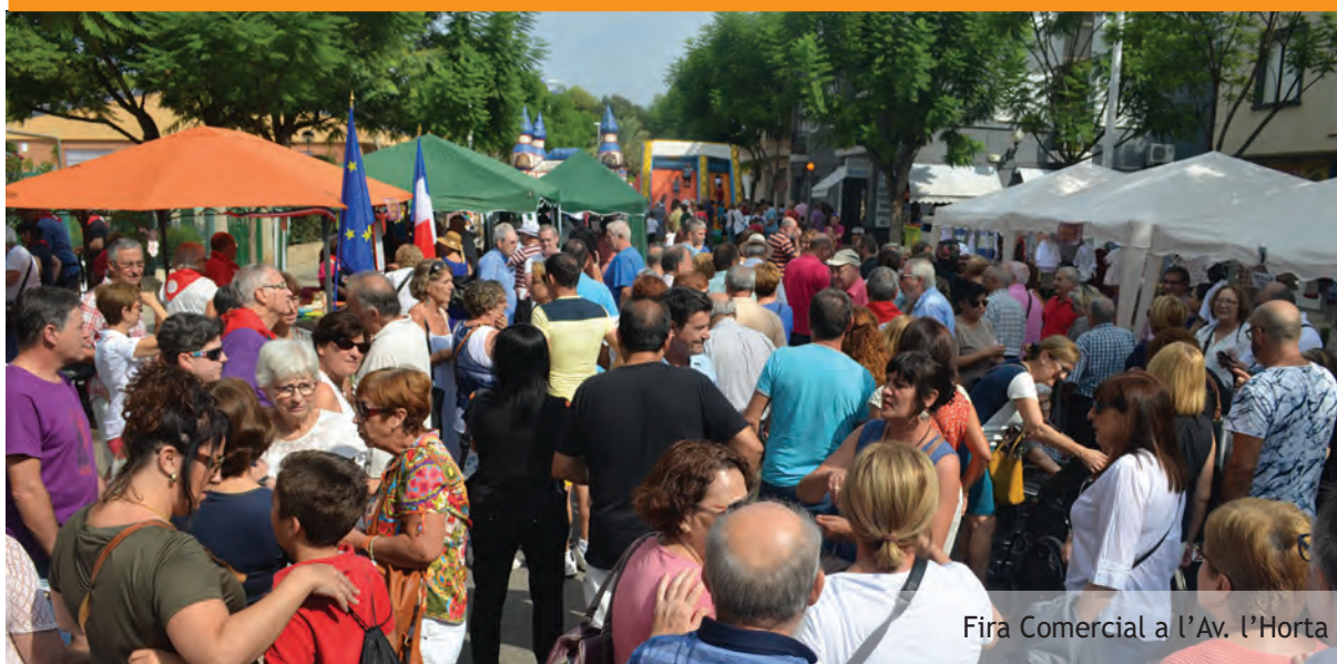
Fira Comercial a l'Av. l'Horta

El primer paso del Plan de Igualdad Municipal es el establecimiento de un plan formal en el Ayuntamiento de nuestra población y que ha de servir de modelo para la extensión de esta iniciativa al resto del tejido económico y social de nuestro pueblo. Los primeros pasos de este plan (que cuenta con la financiación de la Diputación de Valencia) ya se han dado durante el mes de septiembre.