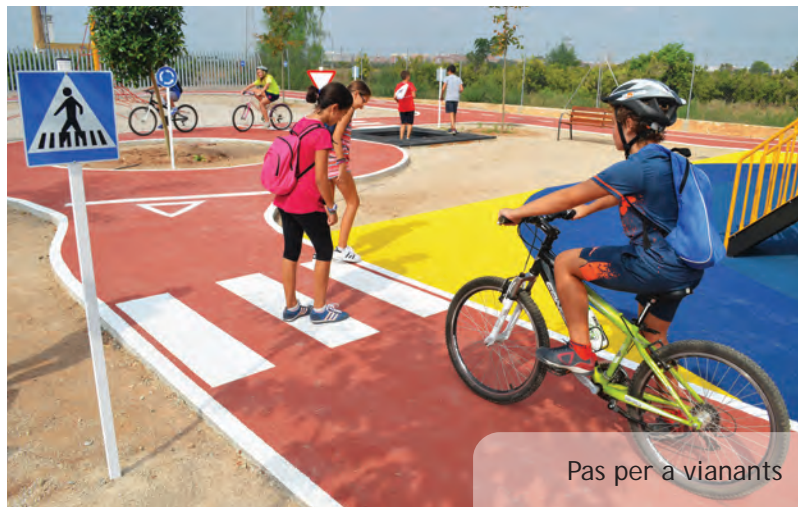
Pas per a vianants