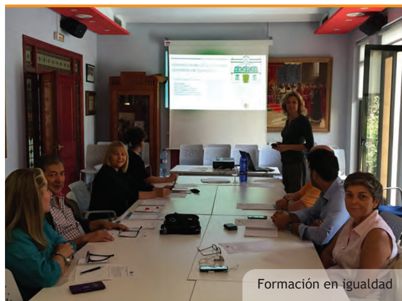
Formación en igualdad

Menos del 4% de los cargos de alta dirección de las empresas están ocupados por mujeres