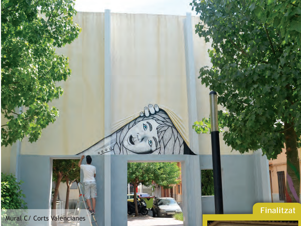
Mural C/ Corts Valencianes