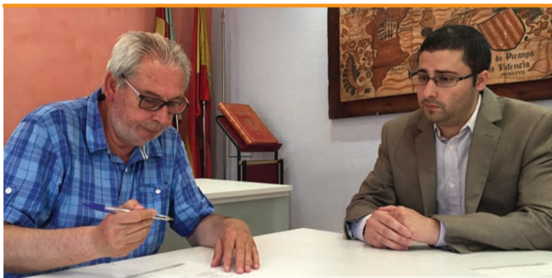
Firma del acuerdo de instalación de Labsearch Innovations SL en el CEAM

Esta formació és requisit imprescindible per a que les persones aturades puguen optar a obtenir la Targeta Professional de la Construcció, un document que permet certificar nivell professional, experiència, formació i que resulta determinant a l'hora d'optar a nous contractes.