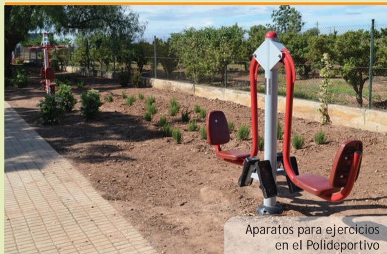
Aparatos para ejercicios en el Polideportivo

En caso de detectar presencia de mosquitos-tigre o presencia anómala otros insectos u otras plagas (roedores) se debe telefonar al Ayuntamiento (tel. 961 594 460) para que la empresa encargada de los tratamientos se ponga en contacto con las personas interesadas y poder evaluar cada situación en el lugar del problema.