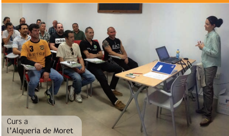
Curs a l'Alqueria de Moret