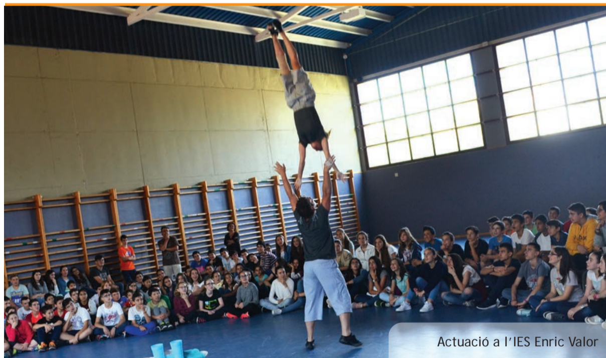
Actuació a l'IES Enric Valor