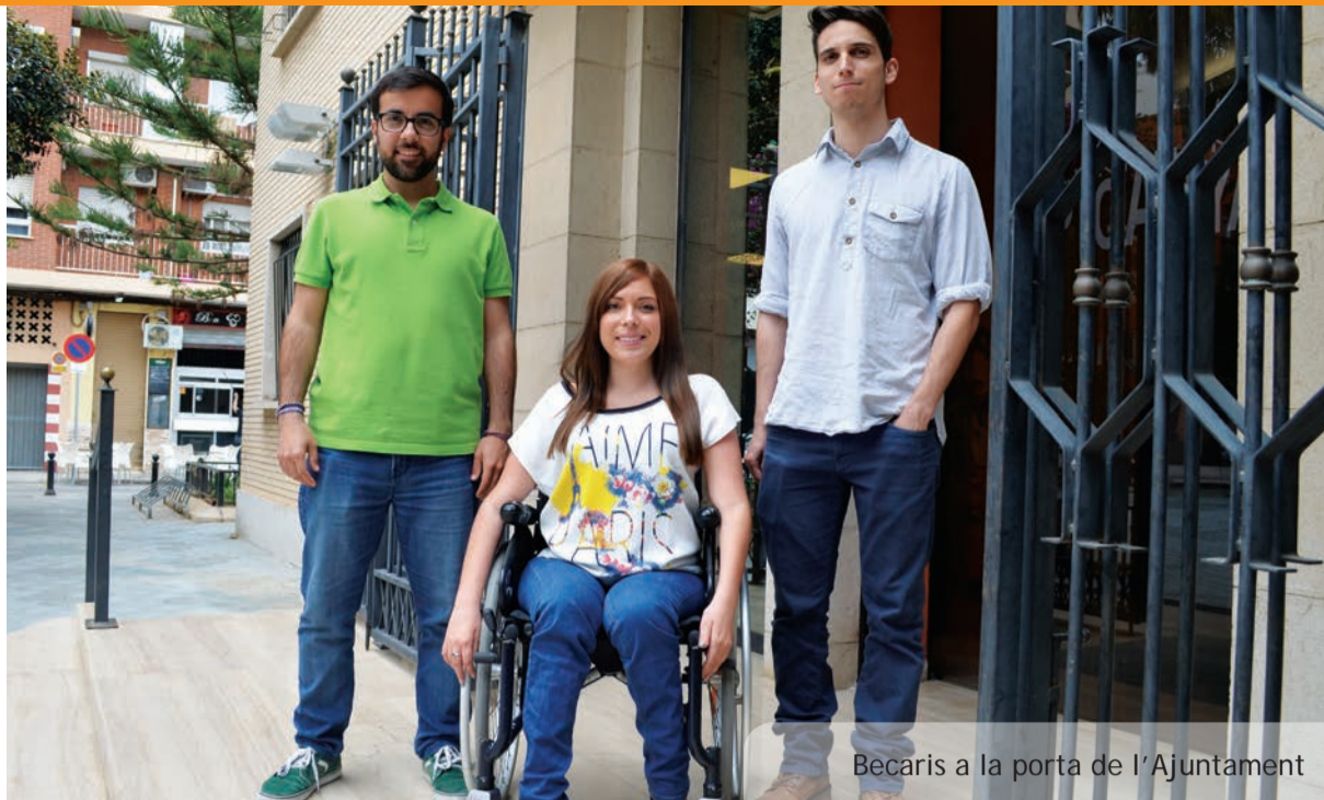
Beccaris a la porta de l'Ajuntament