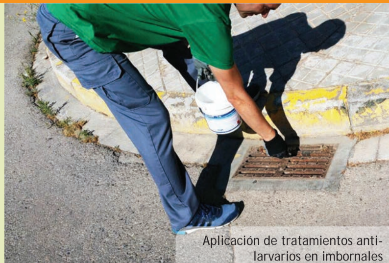
Aplicación de tratamientos anti-larvarios en imbornales

El 7 de maig, diferents entitats de protecció dels drets dels animals, amb la col·laboració de l'Ajuntament de Picanya, han organitzat a l'avinguda Generalitat Valenciana la 1a Fira d'Amics i Amigues dels Animals. Una iniciativa destinada a promoure l'estima pels animals i la responsabilitat que suposen. Les activitats programades foren ben diverses i anaren des d'una divertida exhibició d'agility, a concursos i, fins i tot, diverses desfilades de gossos i gats abandonats destinades a promoure la seua adopció.