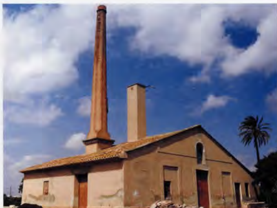
Motor de reg, Hort de Lis

Sovint és freqüent trobar junt al pou una bassa de maçoneria rectangular que oscil·la entre els 200 i 1.000 metres cúbics de cabuda. Tot atenent els trets morfològics del relleu de la comarca, on els forts desnivells estan absents, aquestes es construïen en alt per a què l'aigua eixira per la mateixa pressió cap a la séquia. Aquestes presenten parets fetes de maçoneria de pedres unides amb morter de calç, i el seu gruix sovint és major en la base. Normalment tenen una escala de volta de rajola per accedir d'un o varis trams. Ja que s'ubiquen en la part posterior de la casa, a més servien també per a prendre el bany durant l'estiu. Tenen una vàlvula que s'obri per a evacuar l'aigua cap a les séquies de reg. Aquestes bases encara continuen utilitzant-se actualment per al reg per goteig, tot i que en alguns horts, per tal de obtenir més pressió, la instal·lació s'acompanya d'unes bombes.