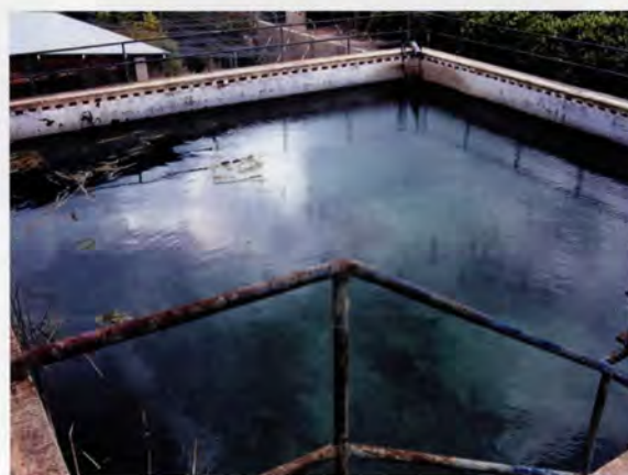
Hort d'Albinyana, detall de la bassa