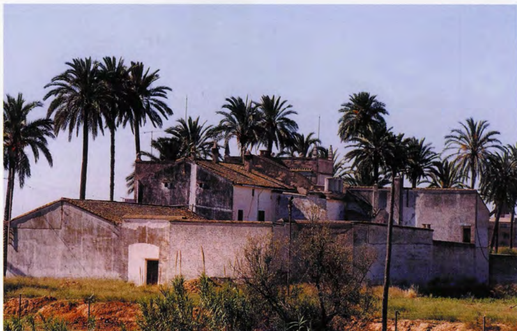
Vista posterior de l'hort de les Plames