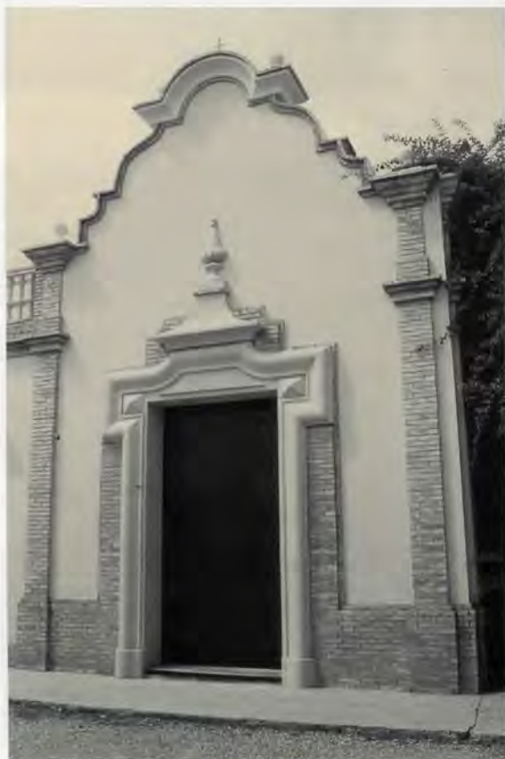
Façana neobarroca de la capella

(15) En aquest sentit resulta molt il·lustrativa aquesta cita de Galiana, J. E.: Guia del turista en València , València, 1929, p. 44: "Al igual que Toledo tiene su estilo monumental, que es el mudéjar, Córdoba el Árabe y Salamanca el Plateresco, Valencia tiene el Barroco como estilo propio. (...) Sin vacilaciones podemos asegurar que la arquitectura barroca es la que mejor representa a la construcción y edificación valenciana". Cita presa de Serra (1996: 75).