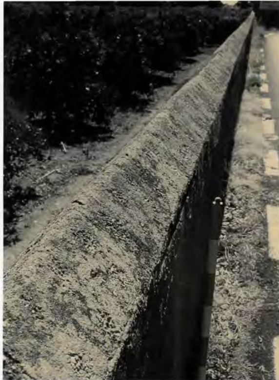
Hort de Veyrat: tanca de maçoneria