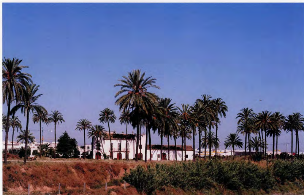
Hort de les Palmes, vista general