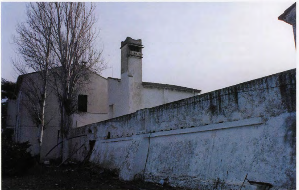
Vista posterior des de la bassa i el motor de reg