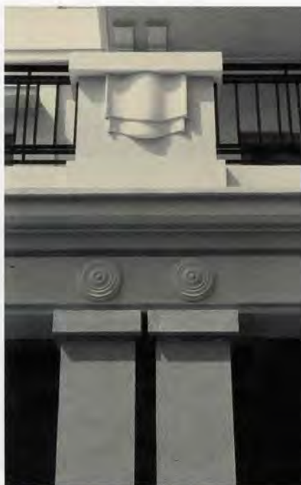
Detall decoratiu del pòrtic d'accés

al conjunt una sensació d'unitat i horitzontalitat, accentuada també per recurs al llenç de rajola vista. Les obertures de les diferents plantes s'alineen en sentit vertical, disposant-se de manera simètrica. Les seues embocadures en alguns casos s'emmarquen amb unes motllures totalment llises, mentre que en altres casos apareixen sense cap motiu ornamental. I totes les embocadures de les finestres de la tercera planta apareixen decorades amb una banda de rajola vista. Per tant ens trobem davant un edifici caracteritzat per una simplificació dels elements decoratius, en la seua majoria provinents de la sintaxi clàssica, emprats en estils cronològicament anteriors, que en alguns casos queden reduïts a la més mínima expressió.