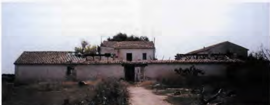
Alqueria de Moret (abans de la seua restauració)

mades per adaptar-les a les noves necessitats residencials dels seus propietaris. Al Nomenclàtor de l'any 1860 trobem una relació dels edificis dispersos, on destaquen sobretot les construccions relacionades amb l'horta, com ara alquerries, i en menor nombre barraques, la majoria d'elles situades a poca distància al voltant del nucli de Picanya. Per tant, hem de pensar en una franja de secà escassament construïda, on moltes de les edificacions disperses que apareixeran al Nomenclàtor de 1888, tot i que no especifica el seu nom ni la seua distància respecte la població, es construirien durant les dècades posteriors al 1860 sobre les franjes de secà limítrofs a les terres d'horta. Segons podem conèixer gràcies als edificis que s'han conservat, la seua planta es basa en els esquemes de casa de l'Horta, formada per un cos principal de dues plantes i dues crugies paral·leles a la façana, i un o dos cossos d'una crugia adossats a la part posterior formant un pati interior.