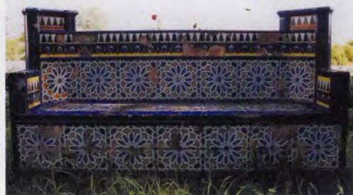
Bancs al jardí