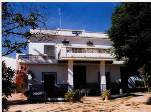
Hort de Montesinos, façana

En la part posterior podíem trobar una sèrie d'instal·lacions situades al voltant d'un pati, relacionades amb l'explotació agrària, com ara estables, pallissa,