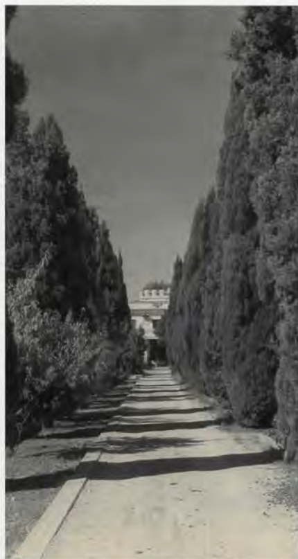
Hort de Montesinos, camí d'entrada

El cos principal de l'edifici respon a la tipologia de casa amb torre centrada en planta, sobre la qual descansen els forjats. L'alçat està format per dos plantes. Els forjats de la planta superior empen biguetes de fusta, sobre les que descansen revoltos de rajola. La coberta, de quatre faldons, recorre també a les biguetes de fusta com a element estructural, damunt les quals descansa un entabacat de rajola recolzat sobre cabirons. La torre central presenta coberta plana, a la qual es pot accedir per una escala, fent així el paper de torre mirador.