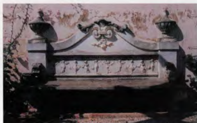
Banc de formigó