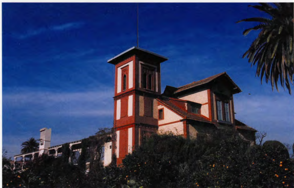
Hort de Coll, vista de la façana sud amb la pèrgola