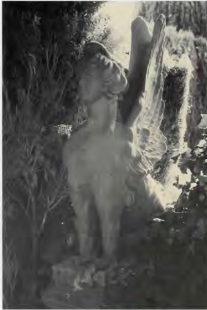
Acròtera de terra cuita