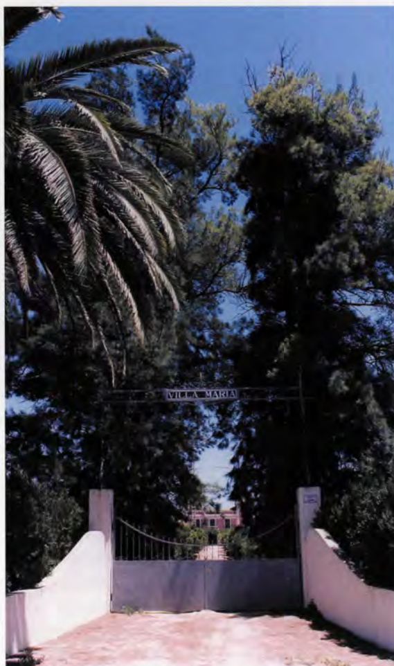
Hort de Gamón, accés principal