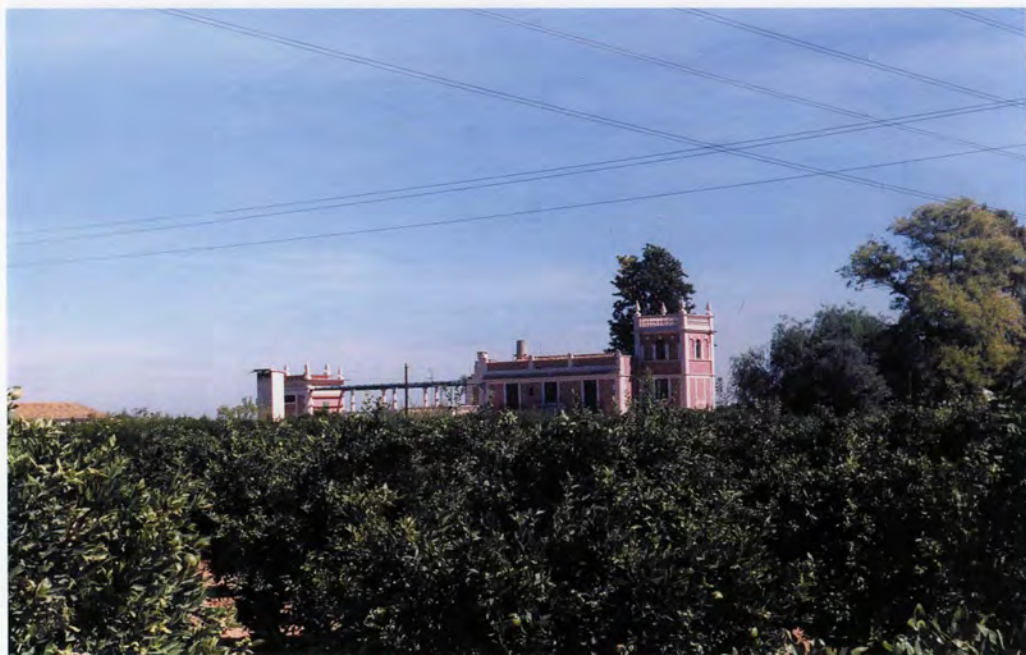
Hort de Gamón, vista general