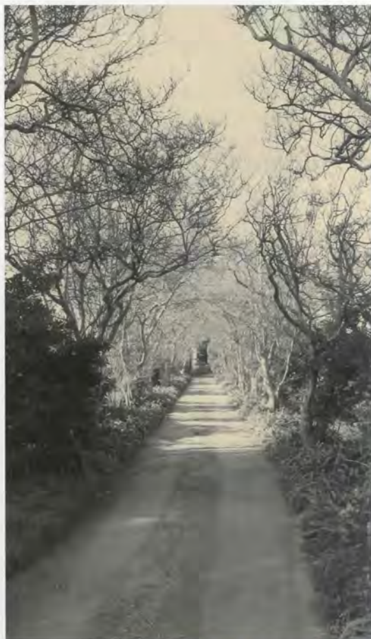
Camí interior d'accés a la casa

La façana principal, orientada cap a l'est, presenta una ordenació en dos cossos, amb una disposició simètrica de les seues obertures, quedant ressaltat l'eix central del seu alçat mitjançant la incorporació d'un altre cos rematat amb una coberta d'ampli ràfec, i amb la presència del pòrtic que precedeix l'accés principal. Els llenços es decoren amb falsa maçoneria rejuntada, i