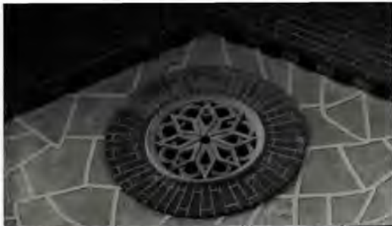
Hort de Coll, rosetó de l'àtic