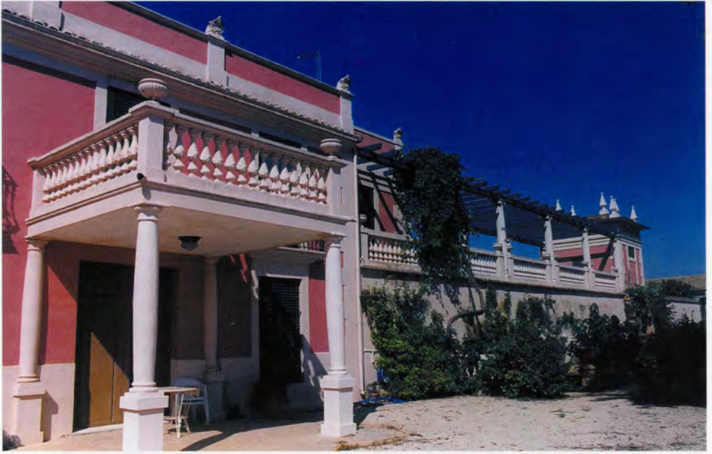
Hort de Gamón, cos lateral