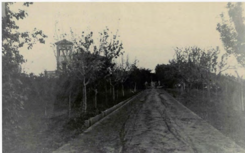
Hort d'Albinyana, camí d'accés a la façana lateral (cap a 1950)