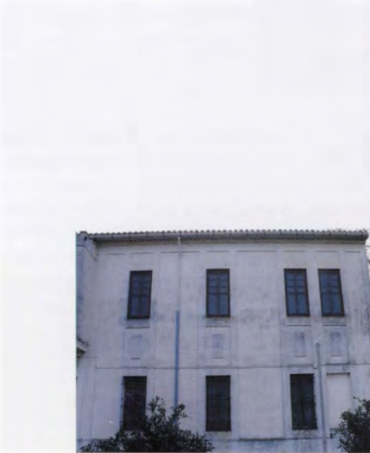
Hort de Veyrat, façana nord