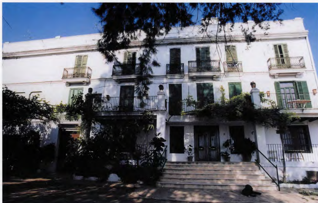
Hort de Pla, façana principal