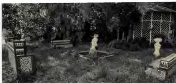
Hort de Pla, font-sortidor al jardí