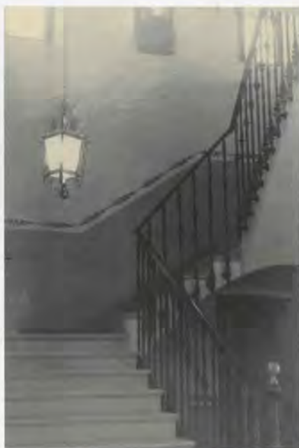
Interior, escala d'accés a la planta superior

rior, motiu pel qual podem parlar d'una arquitectura eclèctica.