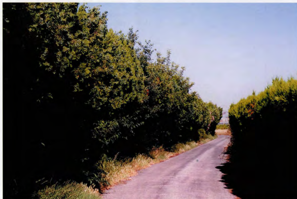
Camí de la Pedrera: tanques de bardissa dels horts