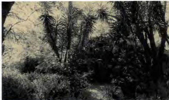
Hort de Pla, bosquet amb la cova i el llac artificial