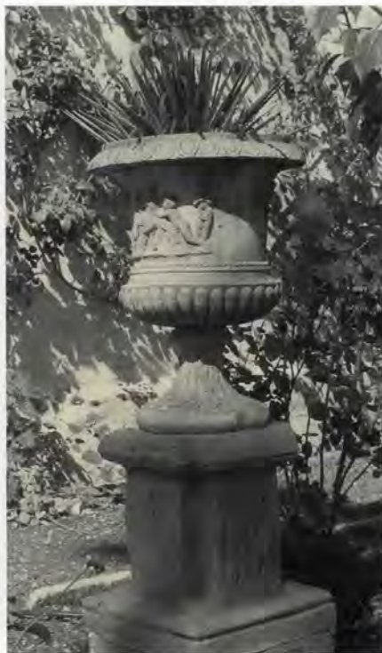
Gerro de terra cuita

les vistes a la galeria superior de la casa, al centre de la qual trobem una figura femenina de terra cuita sobre un pedestal, mentre que al final encontrem un noguer que tanca el final del recorregut. Tal i com hem comentat, davall el colomer se situa boca d'entrada a la gruta artificial. Es tracta d'un element característic del jardí romàntic, present també a altres horts estudiats, com ara el de Pla, on es recrea d'una manera artificial un element de la natura, reproduint al sostre fins i tot les estalactites i insertant plantes naturals entre les juntes de les pedres.