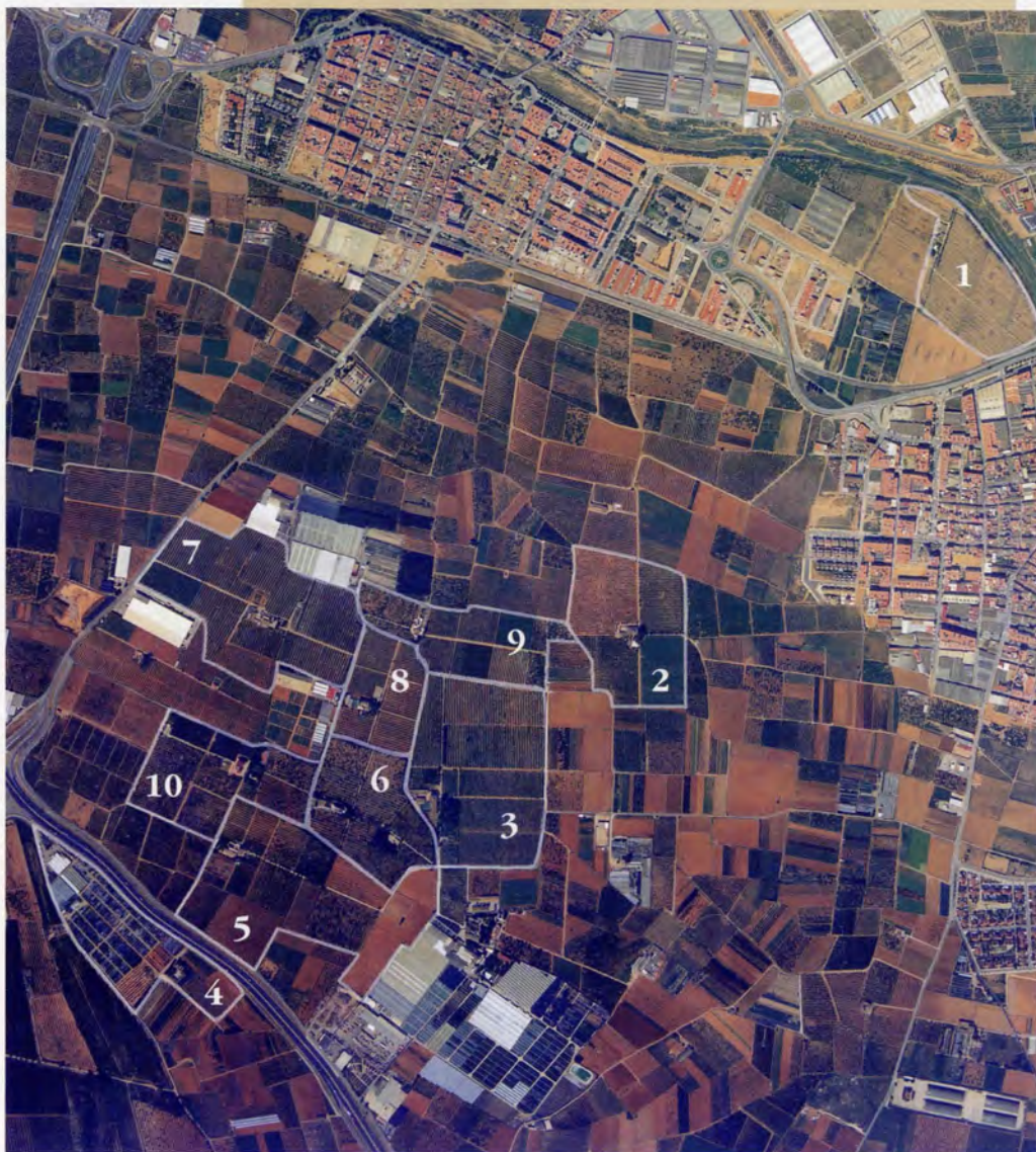
Localització dels horts amb la seua superfície original