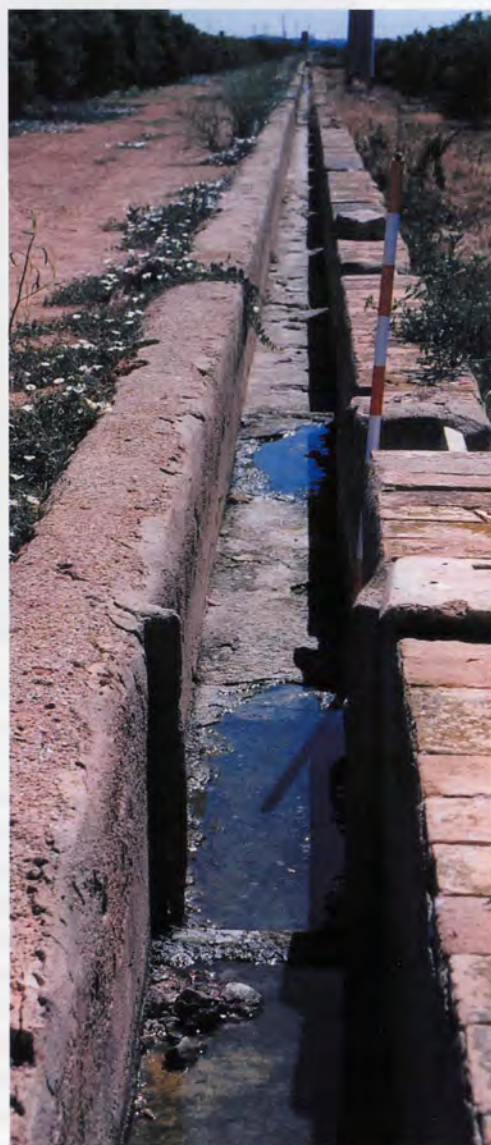
Hort de Pla: séquia, partidior

rellant-se en aquests casos les rajoles de per curt. En un primer moment es tractava de rajola massissa, mentre que posteriorment s'empraria la rajola foradada i el bloc de formigó. Aquestes formes