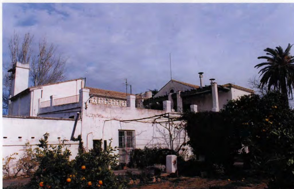
Vista del costat sud