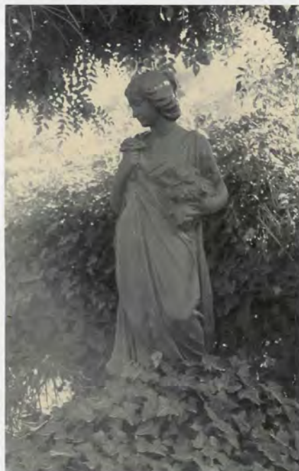
Figures mitològiques de terra cuita a la zona ajardinada

geomètrics, mentre que als bancs, recoberts amb el mateix material, es recorre a repertoris neobarrocs propis de la dècada dels anys trenta (11) on destaca com a element decoratiu la punta de diamant, o neorrenai-xentistes on s'empren elements propis d'aquest estil, com ara els caps alats, predominant en ambdós casos les tonalitats groga i blava.