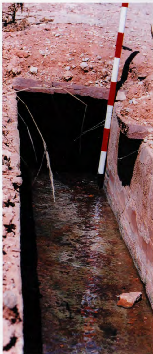
Hort de Pla: séquia, entrador