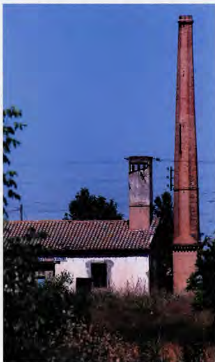
Motor de Valero amb el típic fumeral de rajola

manera generalitzada per tot el terme en crear-se algunes societats civils de regants on la inversió es dividia en participacions que eren adquirides per part dels xicotets i mitjans propietaris. L'any 1916 va entrar en funcionament el motor de Sant Agustí, permetent el reg d'unes cinc-centes fanecades. Posteriorment es construeixen el de Sant Jordi, i el de Sant Miquel en 1928. D'aquesta manera ja en 1933 hi havien funcionant a Picanya vint-i-tres motors, tot incloent els dels horts (BURRIEL, 1971: 401). Per això, a les primeries de la dècada dels anys trenta del segle XX les terres de secà havien desaparegut pràcticament del terme de Picanya.