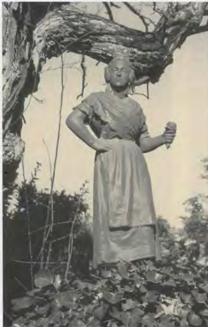
Llauradora de terra cuita

plana on se situa una pèrgola de columnes jòniques i balustrada de formigó encofrat, que presenta trets semblants a la que veurem a l'hort de Gamón, tot i que ací el cos inferior empra el ferro en forma de columnes de ferro colat i biguetes de perfil laminat en forma de I que sostenen els revoltos de rajola. Dins aquest cos trobem integrades algunes dependències agrícoles, com ara el motor amb la torreta de la comesa elèctrica i la bassa.