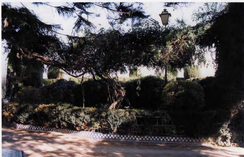
Hort de Coll, jardí