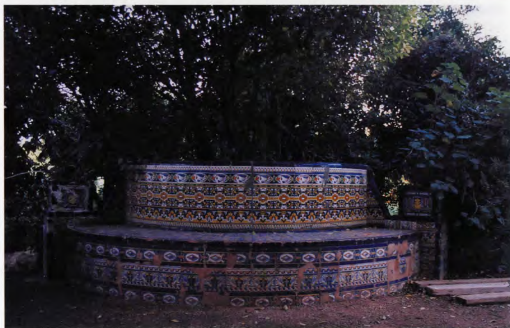
Banc del jardí