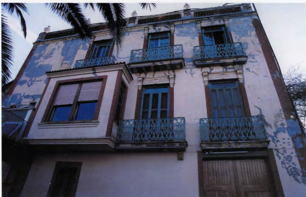
Hort de Coll, façana nord