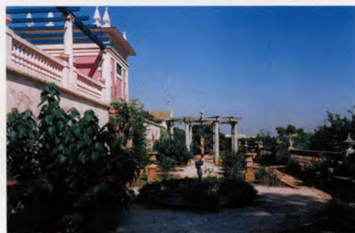
Jardí, vista general