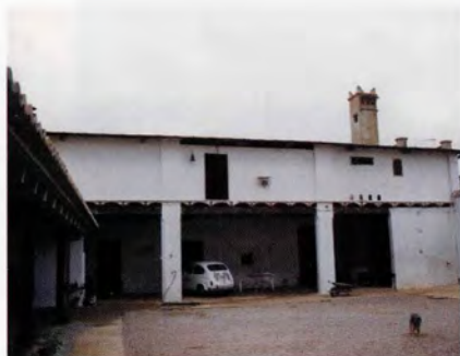
Cos destinat a l'explotació agrícola