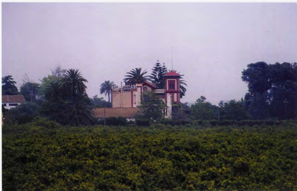
Hort de Coll, vista general