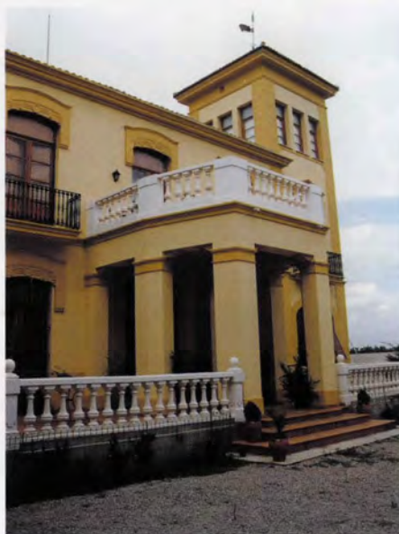
Portic i torre mirador