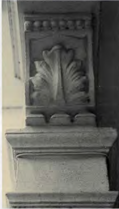
Pòrtic d'accés, mènsula foliada

cadures de les finestres, disposades de manera simètrica. Els espais creats entre les finestres inferiors i superiors es decoren amb plafons ressaltats.