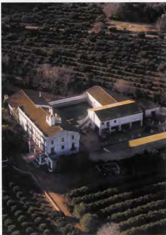
Hort de Pla

SERVICIO GEOGRÁFICO DEL EJÉRCITO: Mapa Topográfico Nacional . Escala 1:25.000.