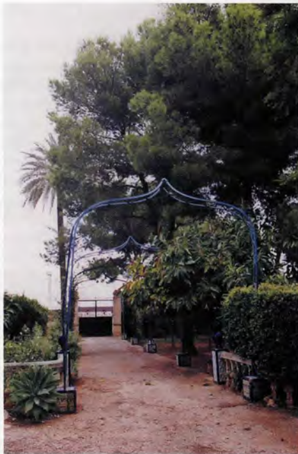
Hort de Lis, passeig del jardí