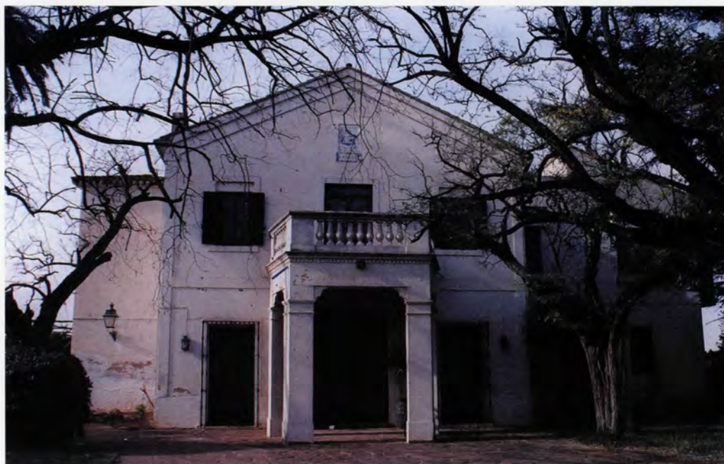
Hort de Veyrat, façana principal