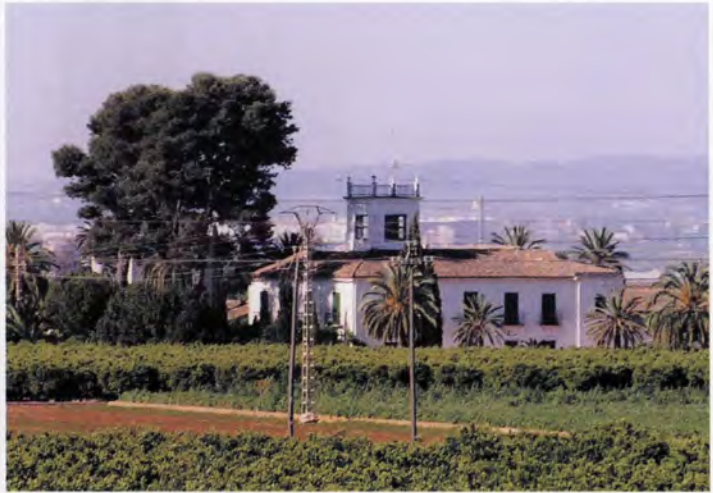
Hort d'Almenar, vista general