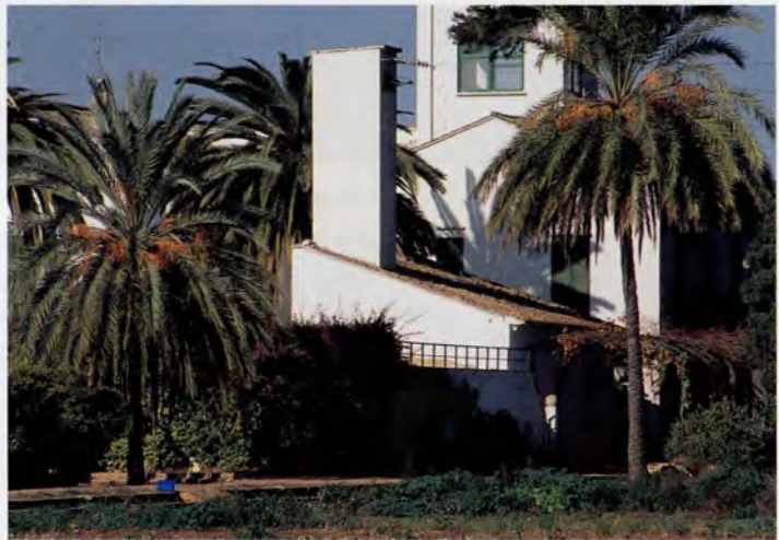
Motor per al reg

tadició barroca, usant-se mallorquines. En la resta de l'hort hi ha reixes de tradició barroca de ferro forjat. Cal destacar la disposició simètrica de les obertures en totes les façanes, que queden desprovistes de qualsevol element ornamental, trencant amb la seua presència la monotonia dels murs llisos de les façanes rematats per un ràfec motllurat.