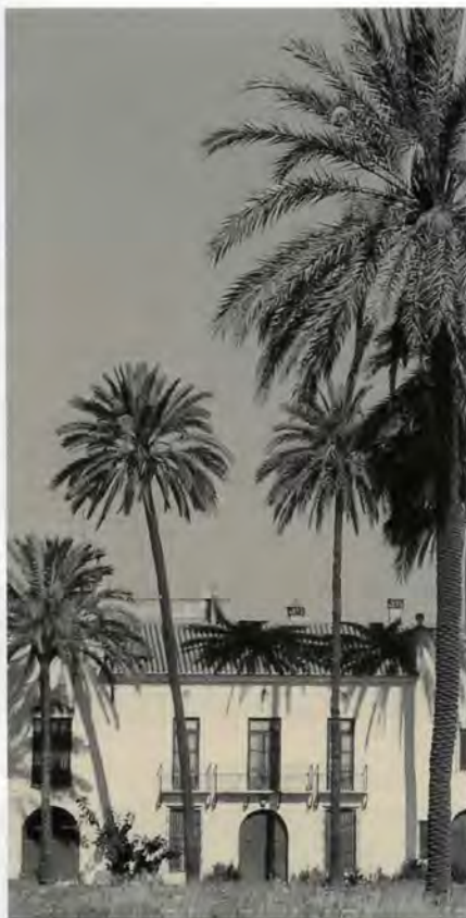
Porta principal d'accés

Els forjats dels sostres segueixen les solucions plantejades per l'arquitectura popular, articulants-se en base a biguetes de fusta que suporten uns revoltons de rajola. D'altra banda,