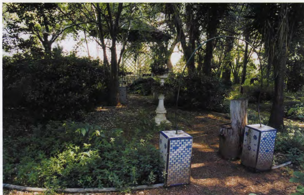
Rotonda a la zona ajardinada