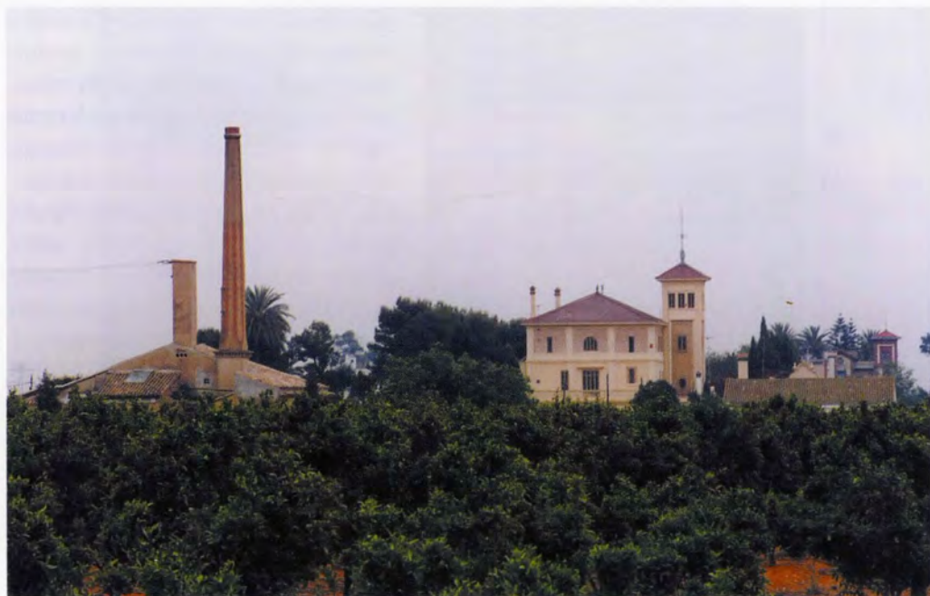
Hort de Lis, edifici i motor de reg amb el típic fumeral