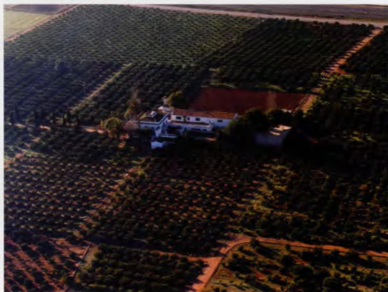
Hort de Montesinos, vista aèria

bassa per al reg, a les quals fa referència el catàleg municipal d'edificis protegits, però que han desaparegut en una reforma practicada en la dècada dels vuitanta, sent reconstruïts aquests volums d'una forma que no té res a veure amb els seus trets estructurals originals.