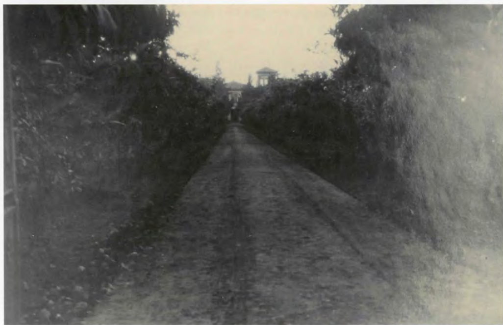
Camí d'accés a la façana principal (cap a 1950)