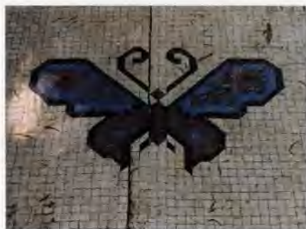
Detall del sol de la glorieta (hort de Pla)

mènsula. Peça d'arquitectura perfilada amb diverses motlures, que sobreix d'un pla vertical i que serveix per a rebre o sostenir alguna cosa.