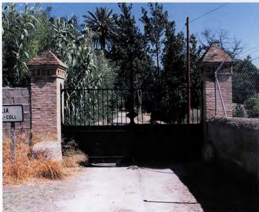
Hort de Pla, porta d'accés

I per últim, tot abans de començar el desenvolupament de l'estudi, vull agrair els membres del Jurat del I Premi d'Investigació d'Estudis Locals de Picanya la confiança dipositada en el projecte que en el seu dia va ser presentat a concurs, cosa que, sense cap dubte, ha possibilitat que a hores d'ara haja esdevingut una realitat. De la mateixa manera vull fer extensiva la meua gratitud cap els propietaris i estatgers dels horts visitats, per totes les facilitats atorgades, sense les quals haguera estat molt difícil la realització d'aquest estudi. També agrair l'Ajuntament de Picanya la seua publicació, gràcies