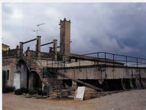
Hort d'Albinyana, motor i bassa de reg