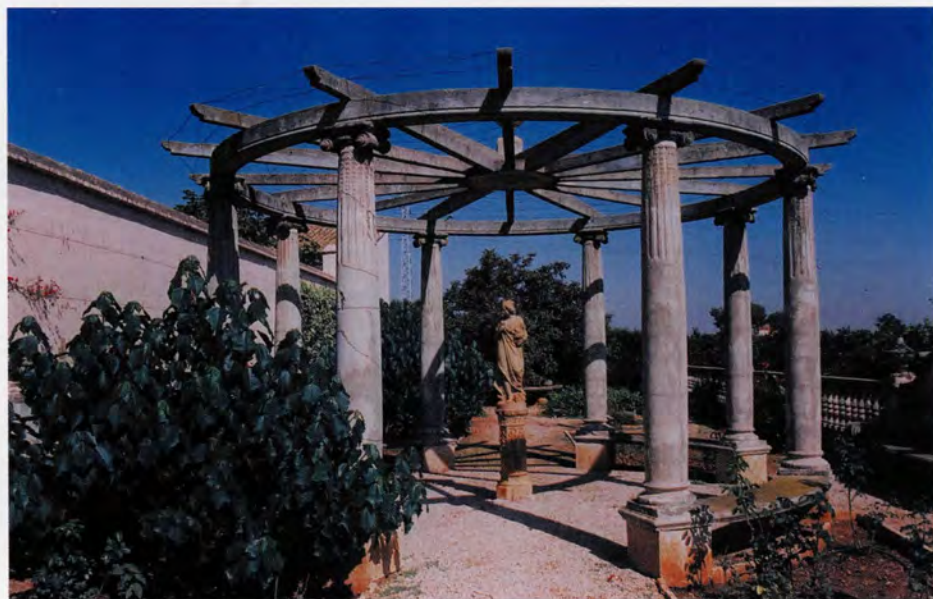
Pèrgola al jardí