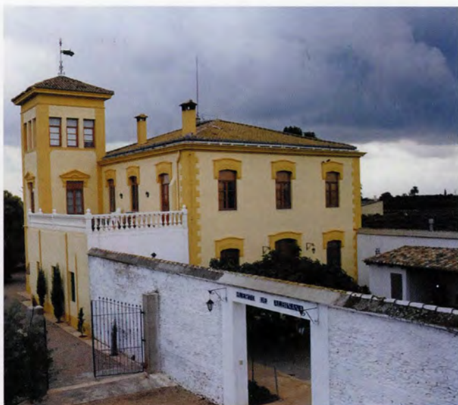
Hort d'Albinyana, vista posterior del conjunt de la vivenda