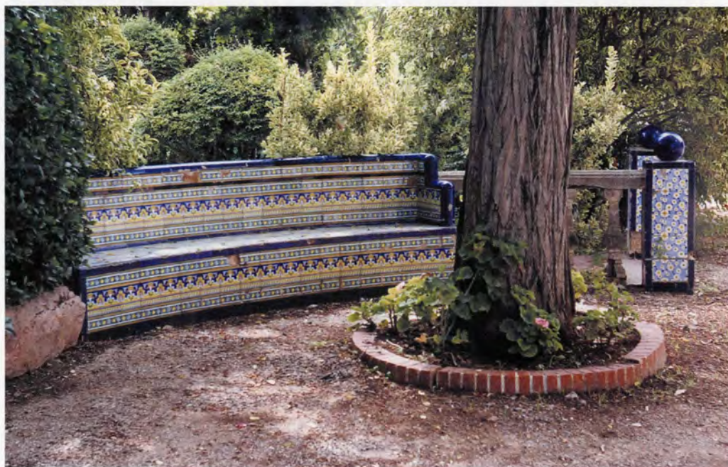
Banc del jardí