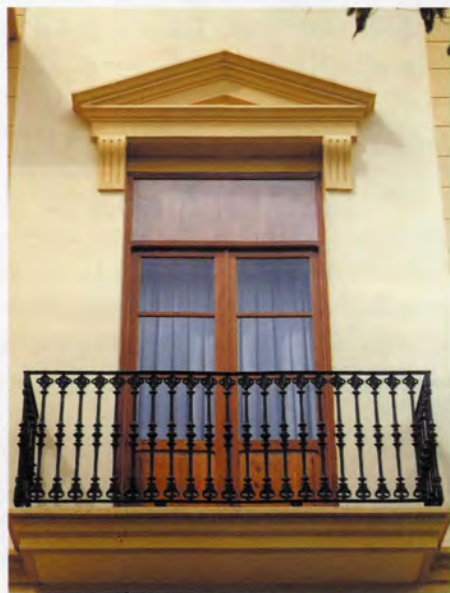
Detall del balcó del mirador