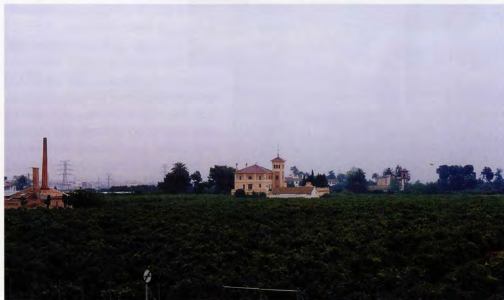
Panoràmica dels horts. D'esquerra a dreta: Motor de l'hort de Lis, hort de Lis i hort de Coll