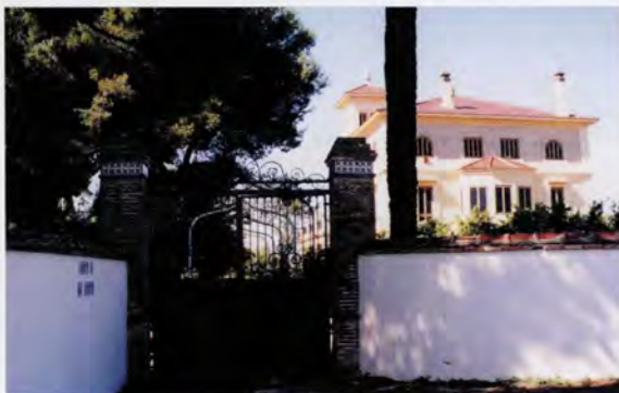
Hort de Lis, porta d'accés

Però, a més de l'accés principal, normalment altres horts disposen d'accessos secundaris que es dirigeixen des del camí de pas fins al centre de l'explotació on se situa la casa, alguns dels quals es tanquen també amb portes de ferro, com es el cas dels horts de Veyrat i de Coll.