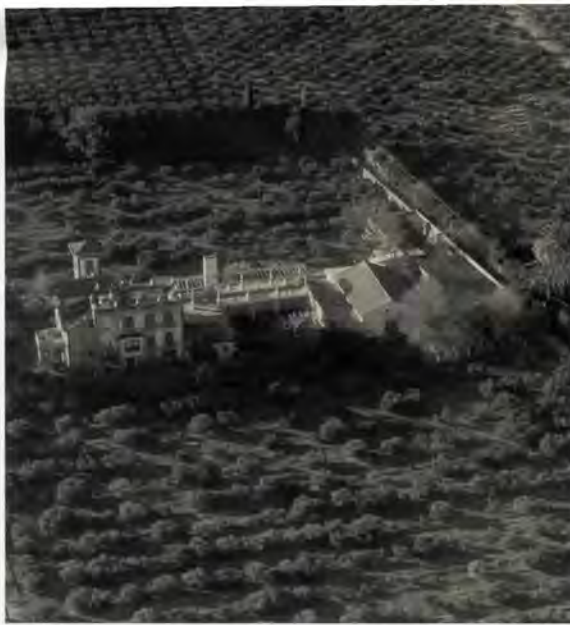
Hort de Coll