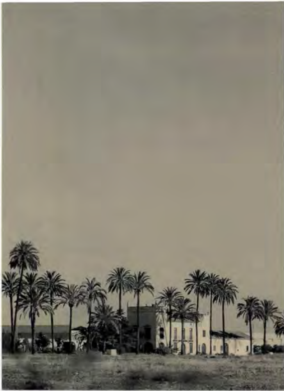
Hort de les Palmes