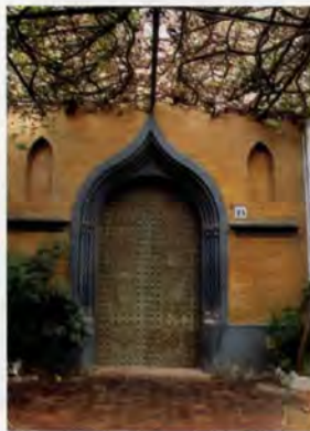
Façana de la capella

és de fusta, recolza plaques ceràmiques que conformen la coberta. El paviment, de mosaic de Nolla, reproduïx sobre un fons blanc elements de la natura com ara garlandes, papallones, etc., disposats d'una manera simètrica al voltant del centre, marcat per una garlanda de flors.