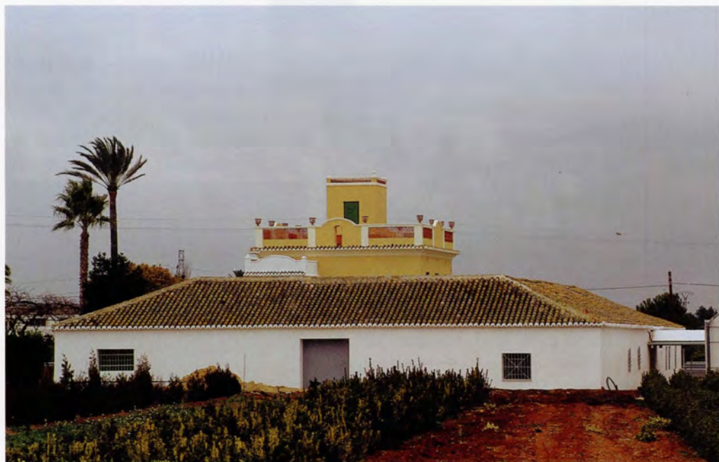
Hort de Villahermosa, vista costat sud