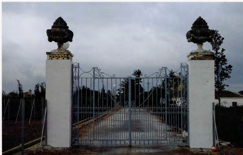
Hort de Villahermosa, porta d'accés reconstruïda en el nou emplaçament