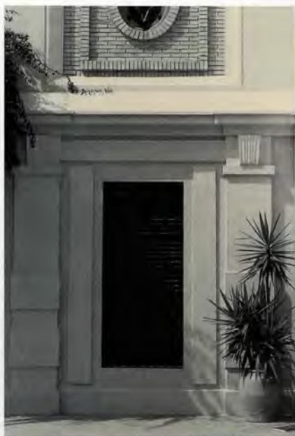
Detall dels elements decoratius de la torre mirador