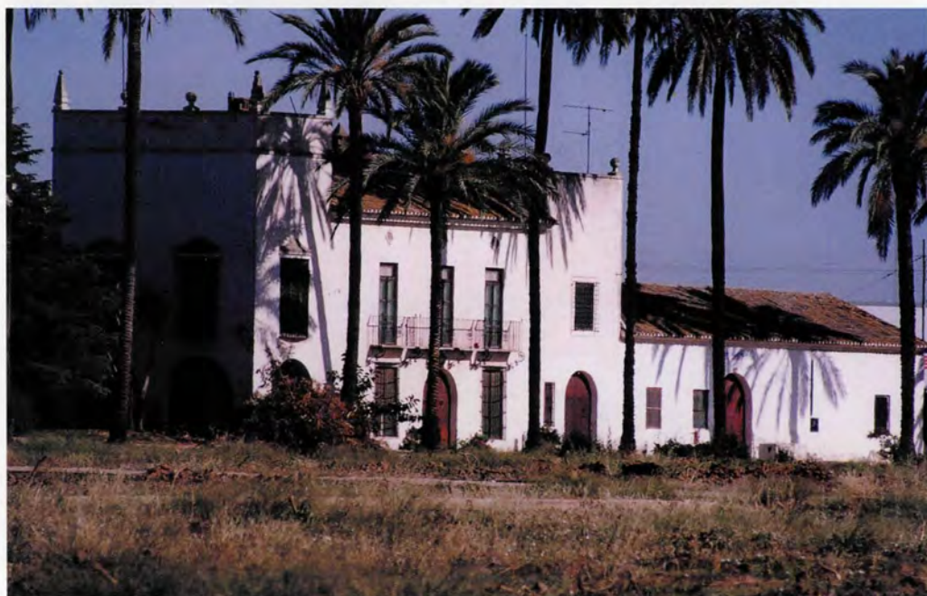
Vista de la façana principal