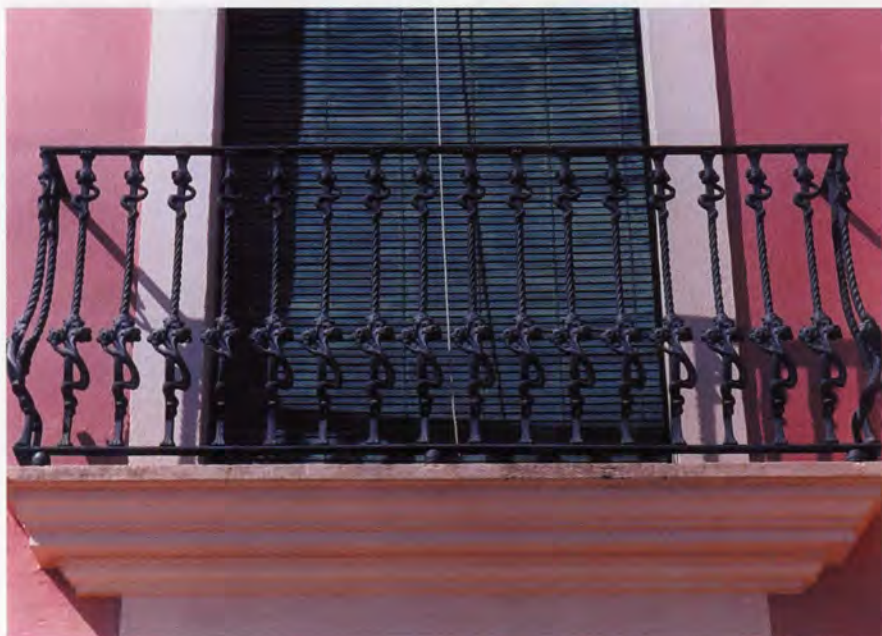
Hort de Gamón: baranes de ferro colat amb motius modernistes