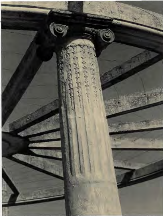
Columna i capitell de la pèrgola de l'hort de Gamón