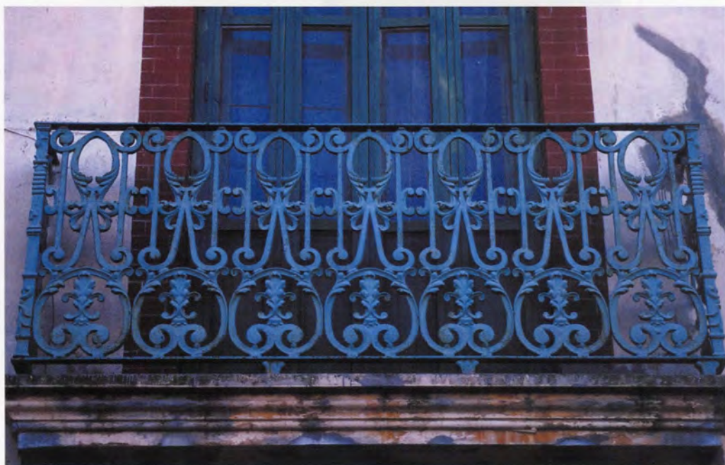
Detall de la barana del balcó