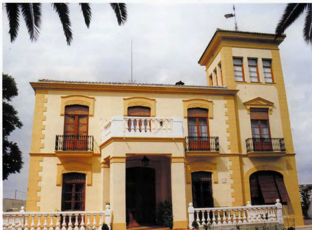
Hort d'Albinyana, façana principal