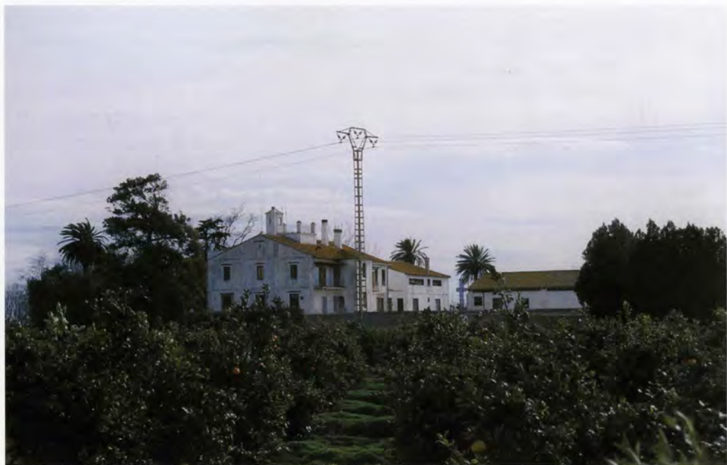
Hort de Pla, vista general