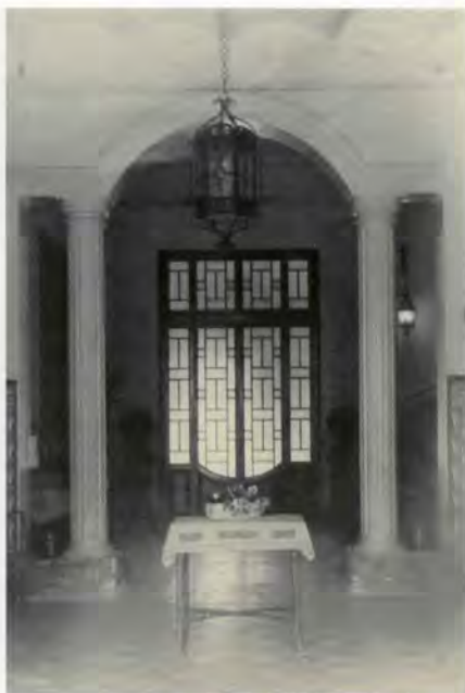
Interior, aspecte original de l'entrada