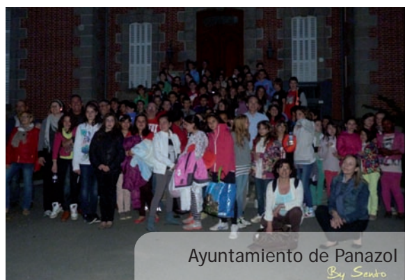
Ayuntamiento de Panazol By Sento