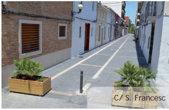
C/ S. Francesc