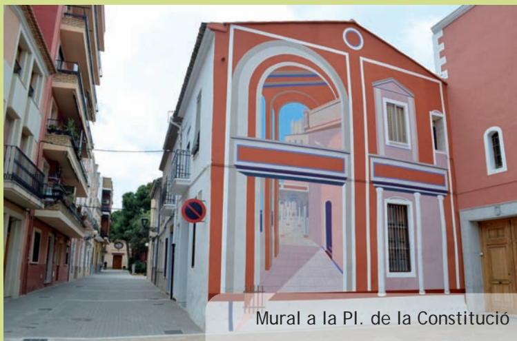
Mural a la Pl. de la Constitució