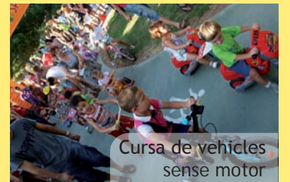
Cursa de vehicles sense motor

Ja des de l'any es pot comprovar l'augment d'activitats adreçades a un públic infantil/familiar. Les festes d'aquest 2013 continuen per eixe camí i, pràcticament, cada dia, podem trobar activitats per a menuts i menudes, a les que, en molts casos, també es convida a participar a pares i mares. Així als ja coneguts jocs unflables o coetà infantil, enguany es tornen a organitzar la concentració de vehicles sense motor (amb canvi de recorregut) i la bombollada i se sumen com a novetat l'organització d'una patinada familiar (amb posterior sopar), unes Olimpíades Populares en les que, a la pinada del Poliesportiu, es convida a participar per equips en jocs tradicionals i esports alternatius, una festa amb jocs d'aigua, una dansa col·lectiva per a gaudir en família i fins i tot una gimkana fotogràfica. Així que ja sabeu, si teniu menuts i menudes a casa, llegiu amb atenció el programa d'aquestes Festes 2013 perquè hi ha molt, i molt bo, on triar.