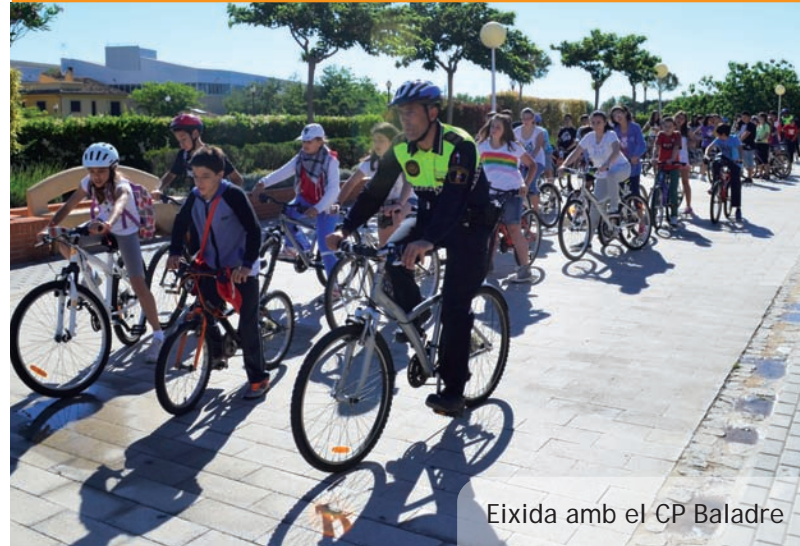
Eixida amb el CP Baladre

A PicanyaTV (www.picanya.org) podeu trobar el document "La Festa del Corpus a Picanya. Entre la devoció i la tradició", un vídeo on, amb imatges dels dos darrers anys i amb la veu de veïns i veïnes es repassen els principals trets que identifiquen el Corpus picanyer, una festa que unix tradició i devoció a parts iguals.