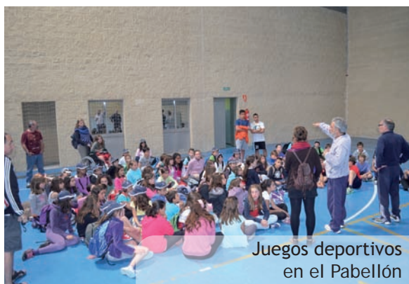
Juegos deportivos en el Pabellón