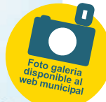
Foto galeria disponible al web municipal