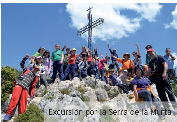
Excursión por la Serra de la Murta

Este intercambio ha sido posible, una vez más, gracias al esfuerzo de todas las partes implicadas: ambos Ayuntamientos, los colegios de Picanya y Panazol, las familias y, muy especialmente, a los miembros del Comité de Hermanamiento con Panazol que han dado todo un ejemplo de trabajo por el bien común.