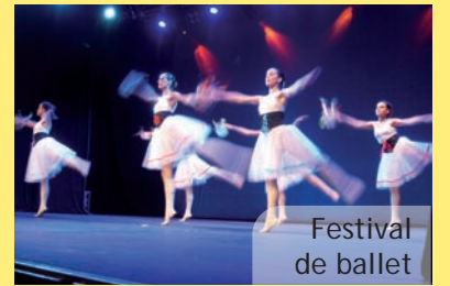
Festival de ballet

Amb aquesta representació l'Associació de Ballet de Picanya també vol celebrar els seus 25 anys de vida, una efemèride, que a més els suposarà rebre el més alt reconeixement de l'Ajuntament de Picanya: la medalla de la Vila que recolliran el dia de la Festa.