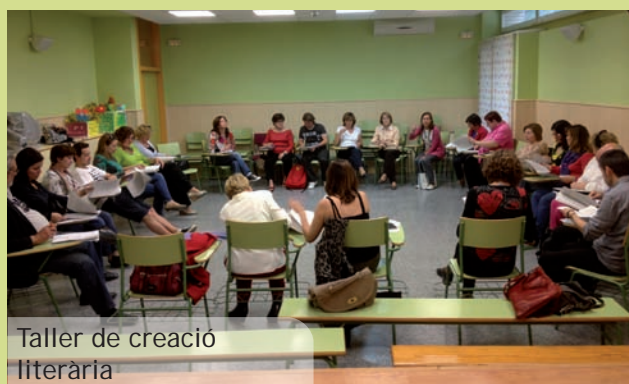
Taller de creació literària