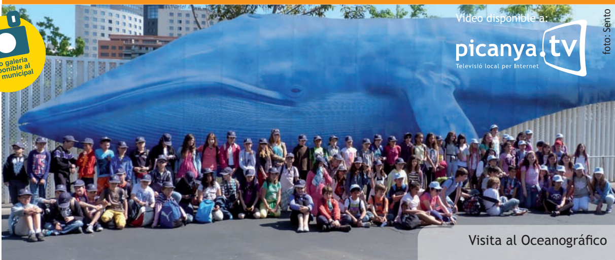
Visita al Oceanogràfic