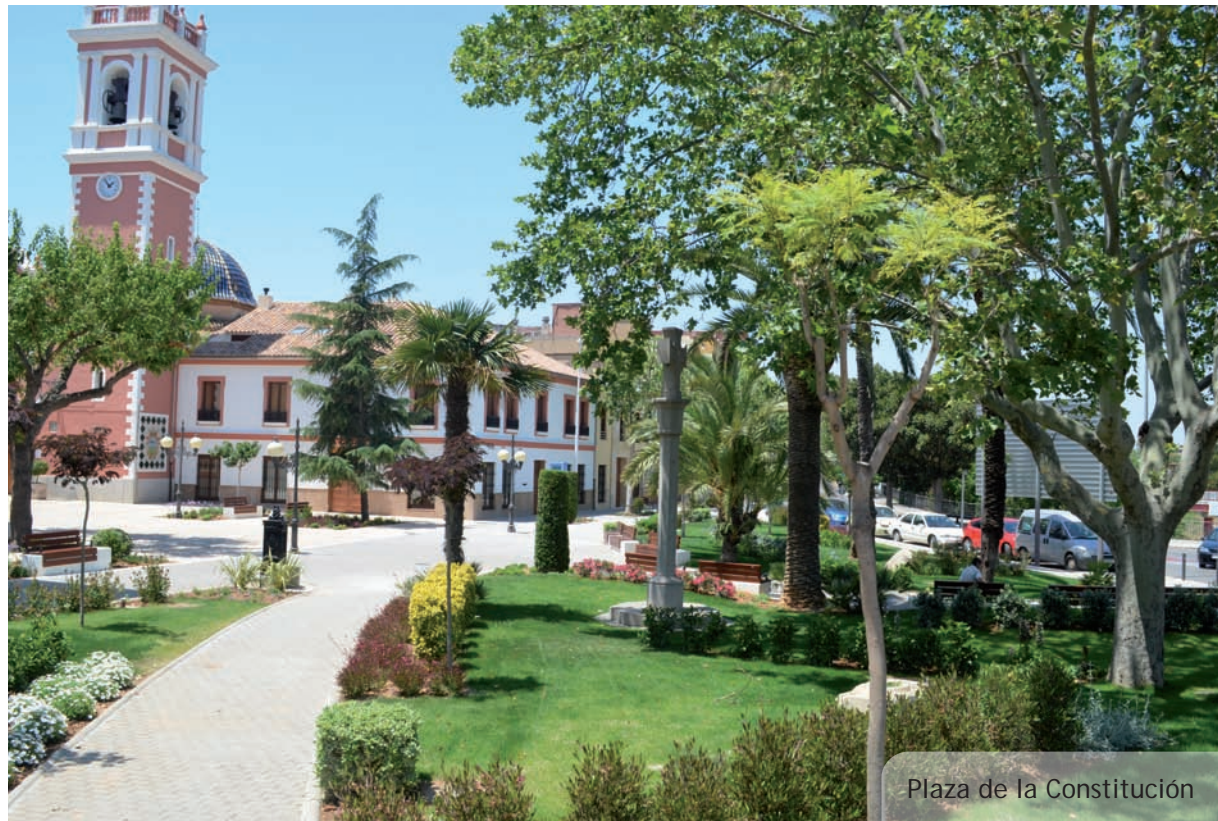
Plaza de la Constitución