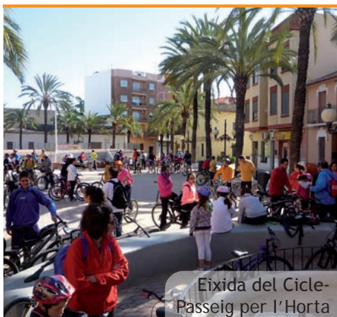
Eixida del Cicle-Passeig per l'Horta