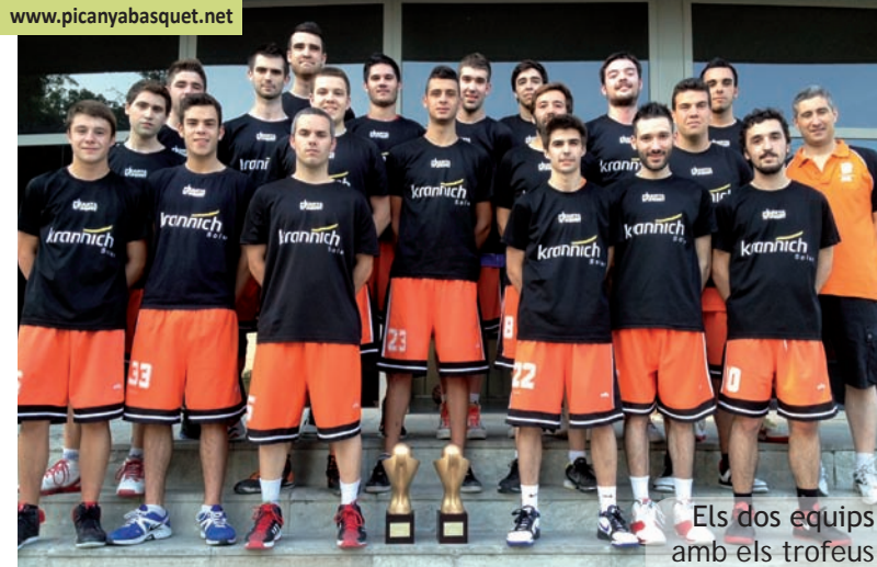
Els dos equips amb els trofeus