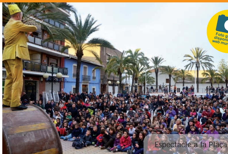
Espectacle a la Plaça

Foto galeria disponible al web municipal