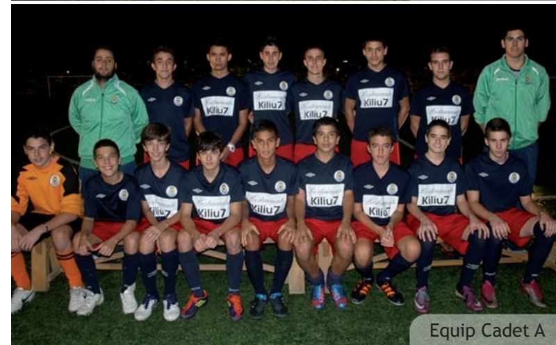
Equip Cadet A