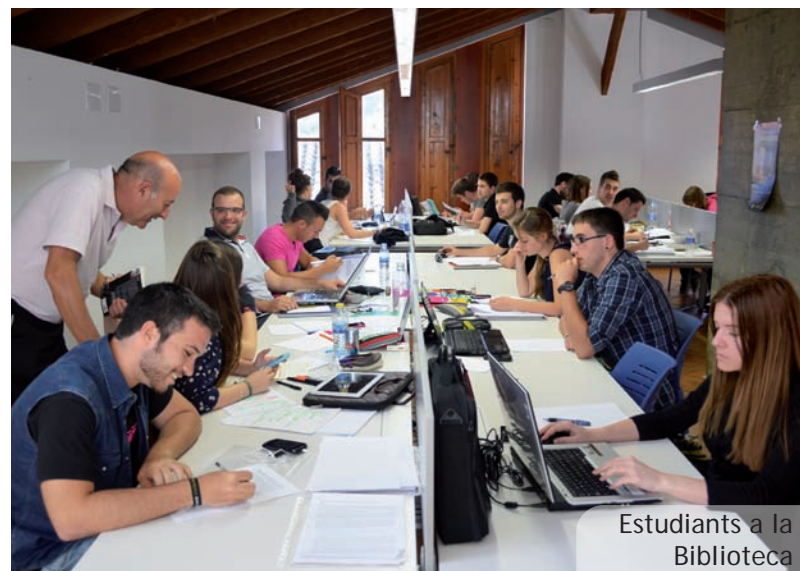
Estudiants a la Biblioteca

Tot això ens ofereix un perfil d'estudiant que ha de ser: resident a Picanya, estudiant dels darrers cursos, amb bona formació complementària i bon nivell d'idiomes estrangers i també de coneixement del valencià. Aquestes són, amb particularitats, les característiques que compleixen els 36 estudiants seleccionats per a fer pràctiques formatives durant els mesos de juliol i agost a l'Ajuntament, on realitzaran treballs relacionats amb la informàtica, l'urbanisme, la gestió econòmica, cultura, esports, comunicació... i podran tindre un primer contacte amb el món del treball i millorar el seu currículum amb una primera experiència laboral.