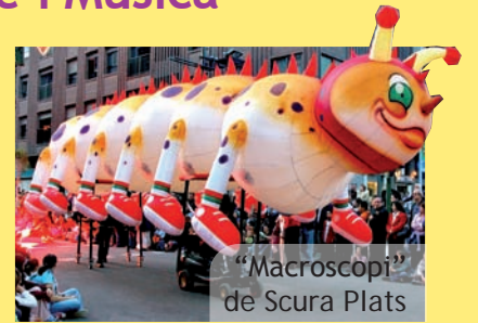
"Macroscopi" de Scura Plats

Un esdeveniment cultural per a tots els públics que disfruten majors i menuts i que, en 7 anys de vida, ja ha esdevingut un referent i un tret identitari de les Festes Majors del nostre poble.