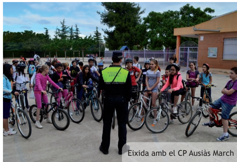
Eixida amb el CP Ausiàs March