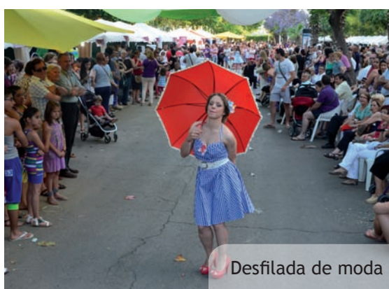
Desfilada de moda