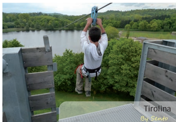
Tirolina By Sento