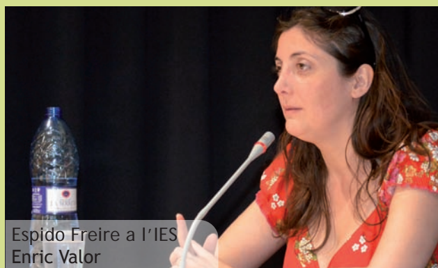
Espido Freire a l'IES Enric Valor

A més, aquesta edició 2013 es va obrir amb una classe magistral a càrrec de la reconeguda escriptora Espido Freire, una de les autores més importants del paronama de la literatura espanyola actual (guanyadora del Premi Planeta). Espido Freire, davant de més de 100 persones que plenaven el saló de sessions de l'IES Enric Valor, va desgranar les claus a l'hora de redactar un text literari.