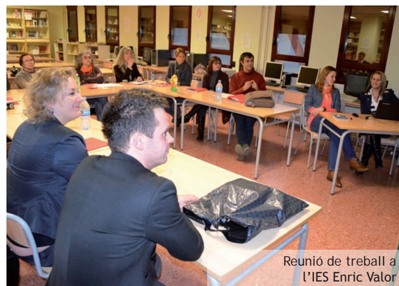
Reunió de treball a l'IES Enric Valor

Aula Mentor pone a tu disposición formación actualizada i de calidad, por tanto si quieres ampliar tu formación, puedes encontrar toda la información en: www.aulamentor.picanya.org .