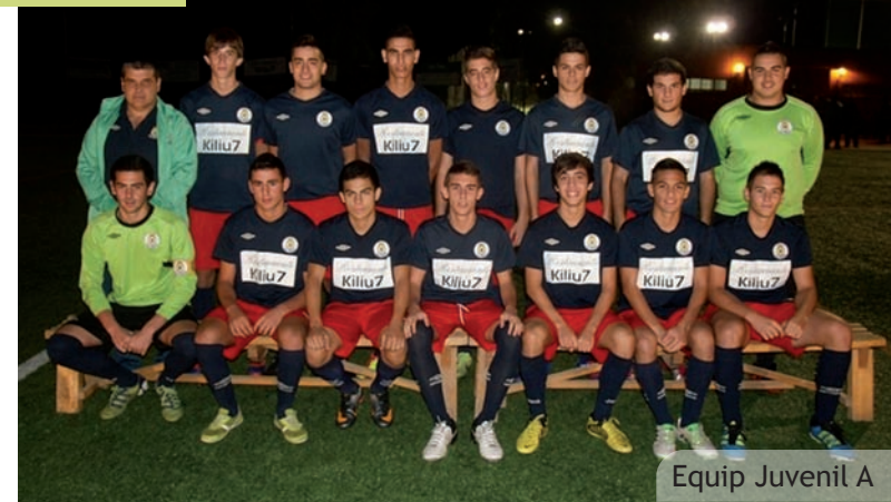
Equip Juvenil A