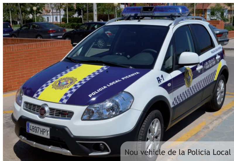
Nou vehicle de la Policia Local

L'objectiu d'aquesta iniciativa és millorar la seguretat dels nostres menuts i menudes en els seus desplaçaments pels carrers i evitar accidents al temps que es dona a conèixer i s'apropa als nostres escolars el treball de la Policia Local.